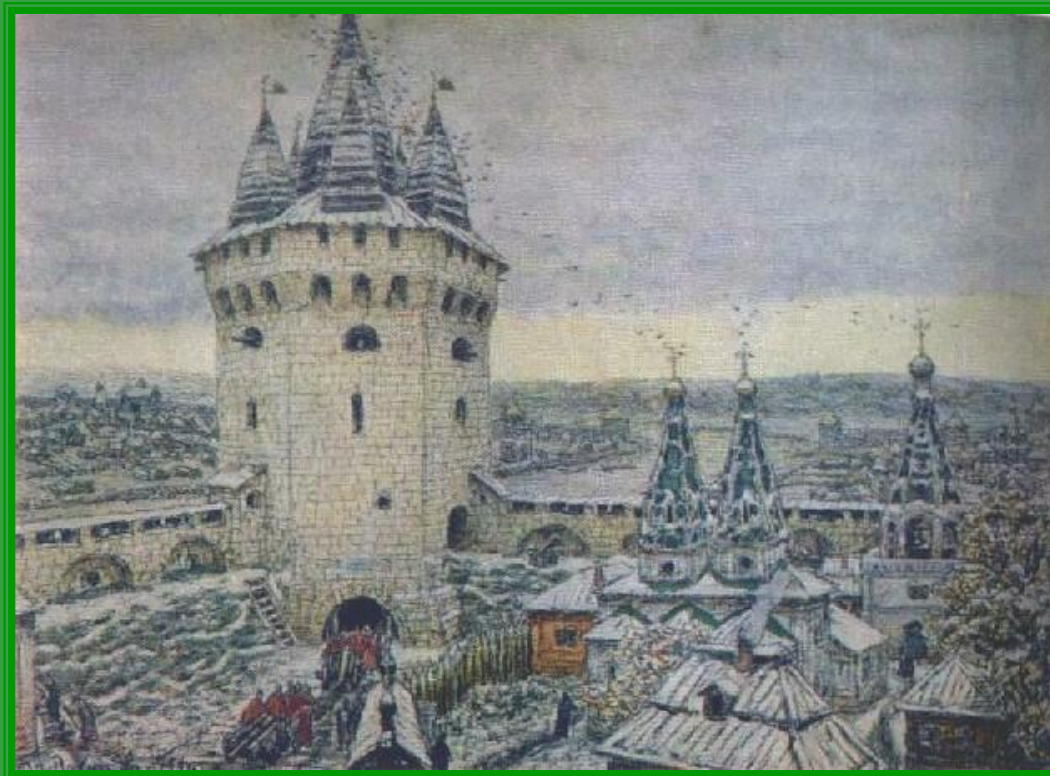
Семиверхая угловая башня Белого города