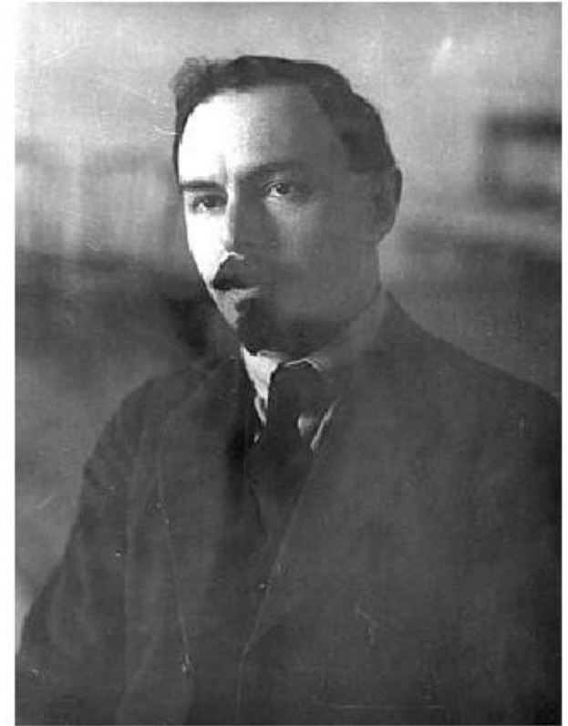
Я. Сокольников, нарком финансов.