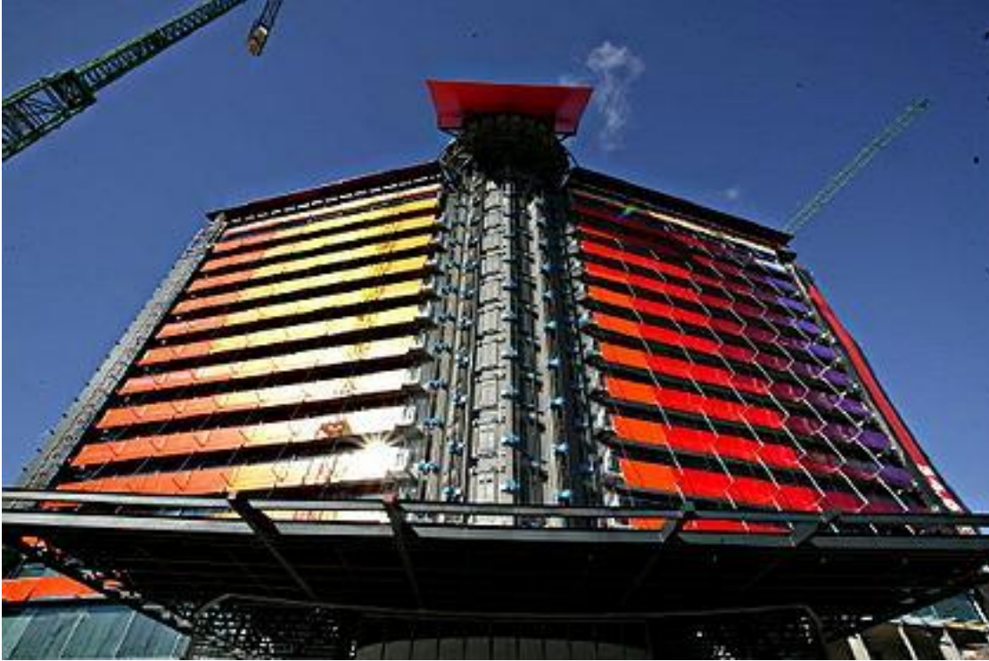
Испания, Мадрид, 2005 Отель Puerta América