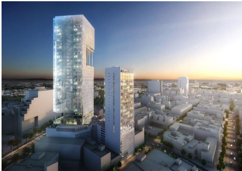
Reforma Towers - многофункциональные башни, Мексика