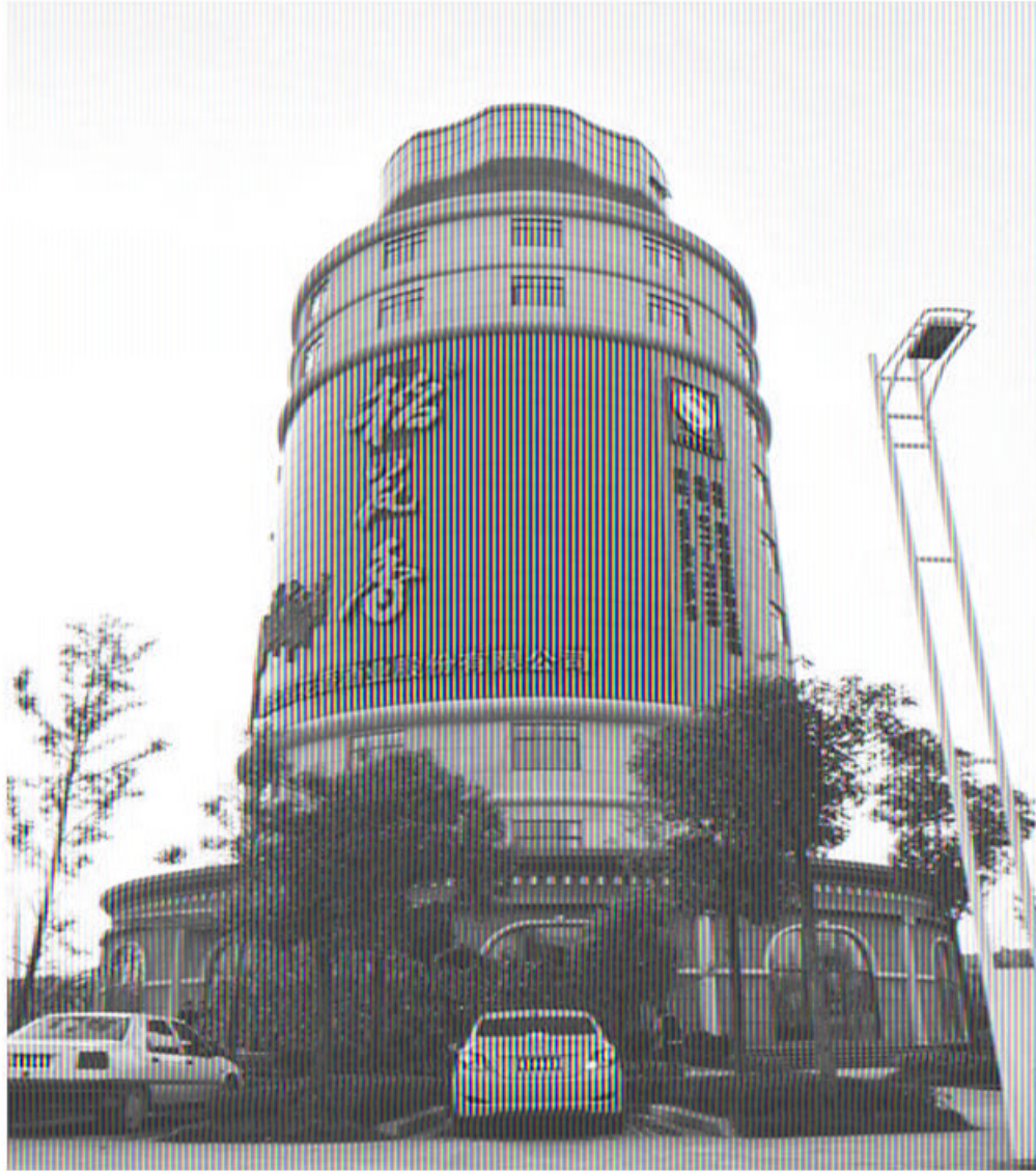
Офисный центр компании Дао Хуа Сян Китай, г.Ичан Большая яркая реклама на здание портит и так без того скучный фасад. Здание похоже на маяк, однообразные окна не сочетаются с завершением остекленной верхней части.