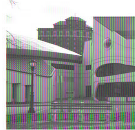
Дом в виде черепахи (США, Ни) Непривлекательная архитектура центра.