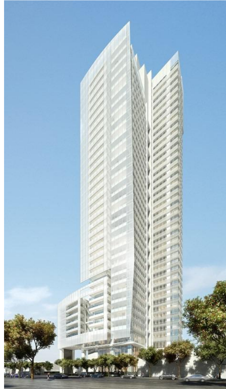
Мексика, Мехико, 2013 Комплекс Reforma Towers