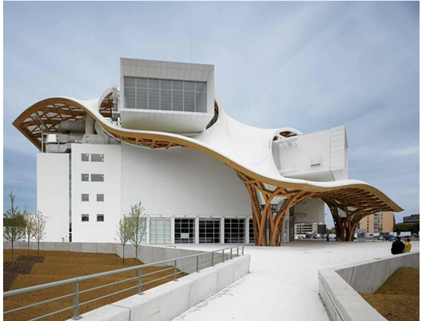
Центр Помпиду-Мец — музей современного искусства в городе Мец.