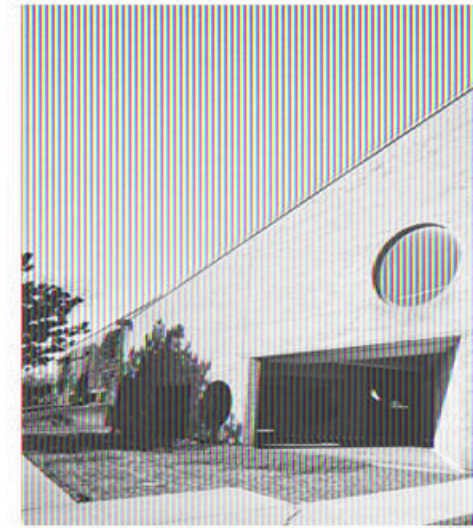
Здание городского правительств Не понятно чем обусловлена дан окна не сочетаются с остроконем поступает малое количество свет понятно, что это здание правите