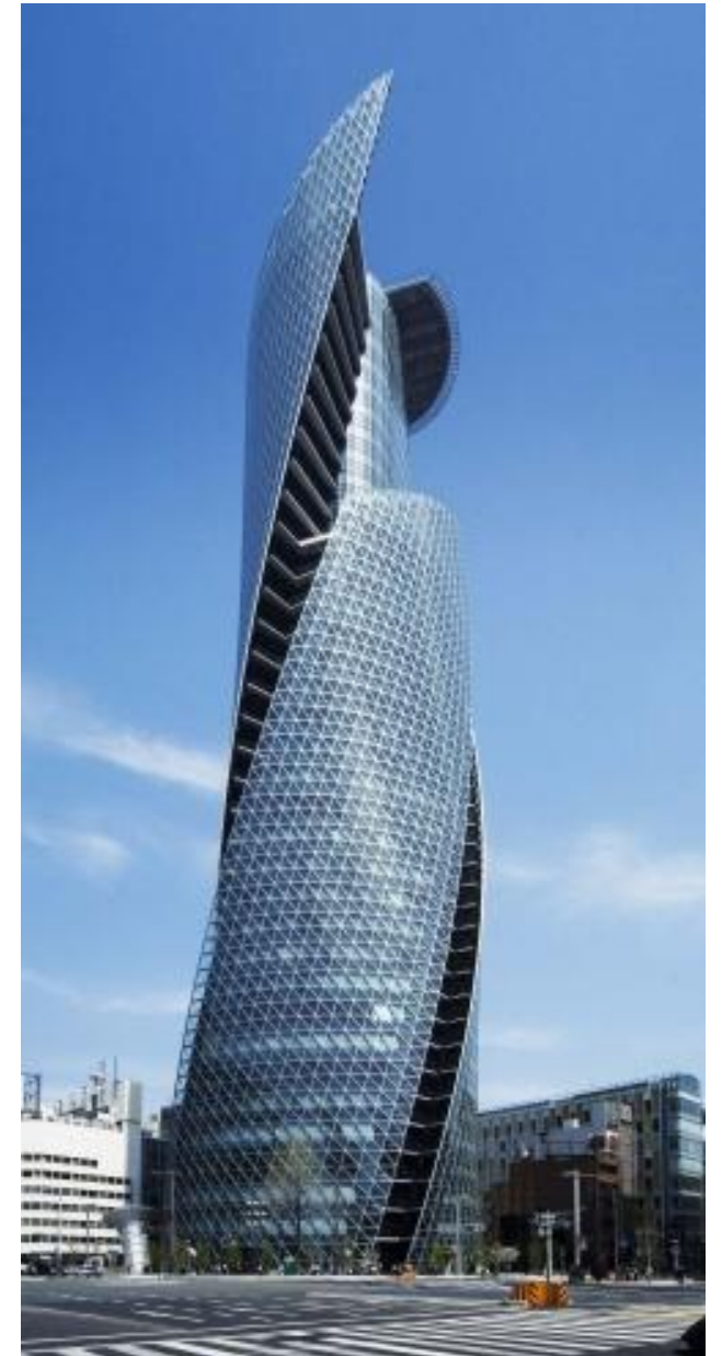
Башня Mode Gakuen Spiral Towers в Нагое. 2008