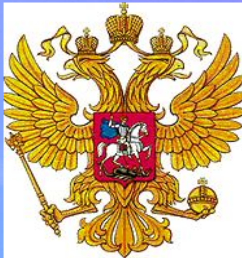
Рисунок герба выполнил художник Евгений Ильич Ухналев.

Современный государственный герб РФ свидетельствует о том, что наша страна – независимое государство с многовековой историей, а все мы граждане суверенной страны – России.