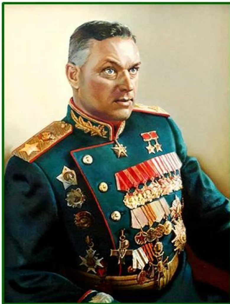
Рокоссовский К. К.