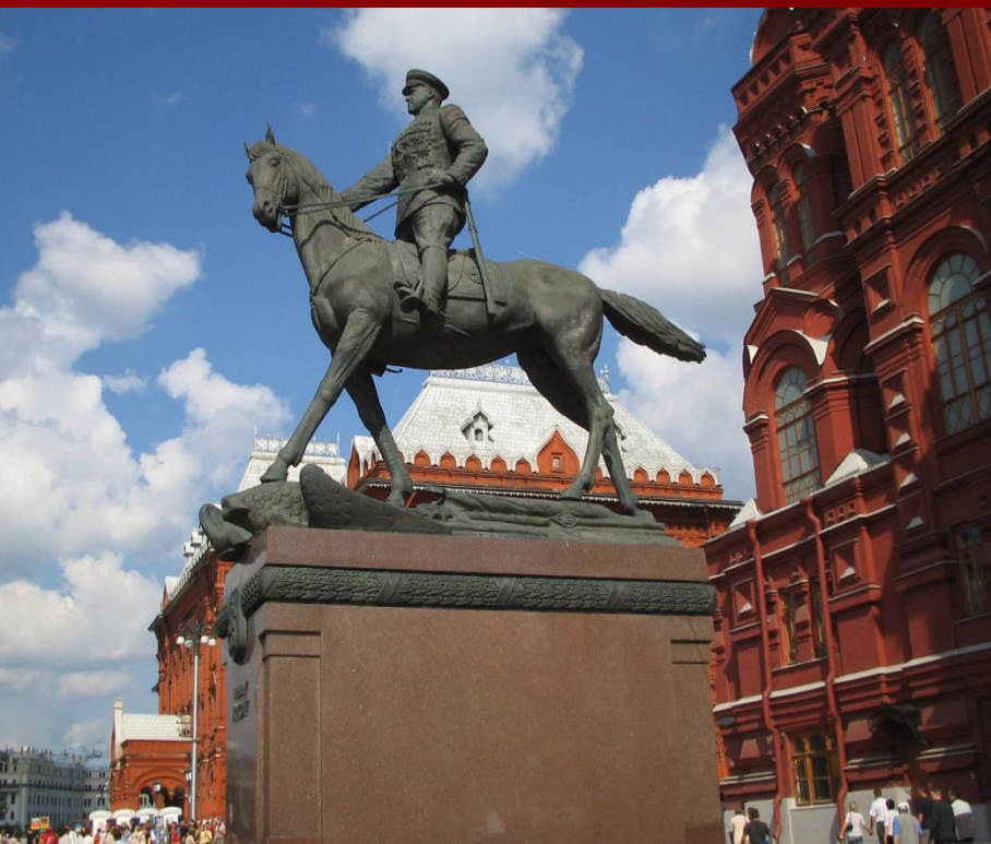
Памятник Жукову в Москве. Скульптор В.М. Клыков