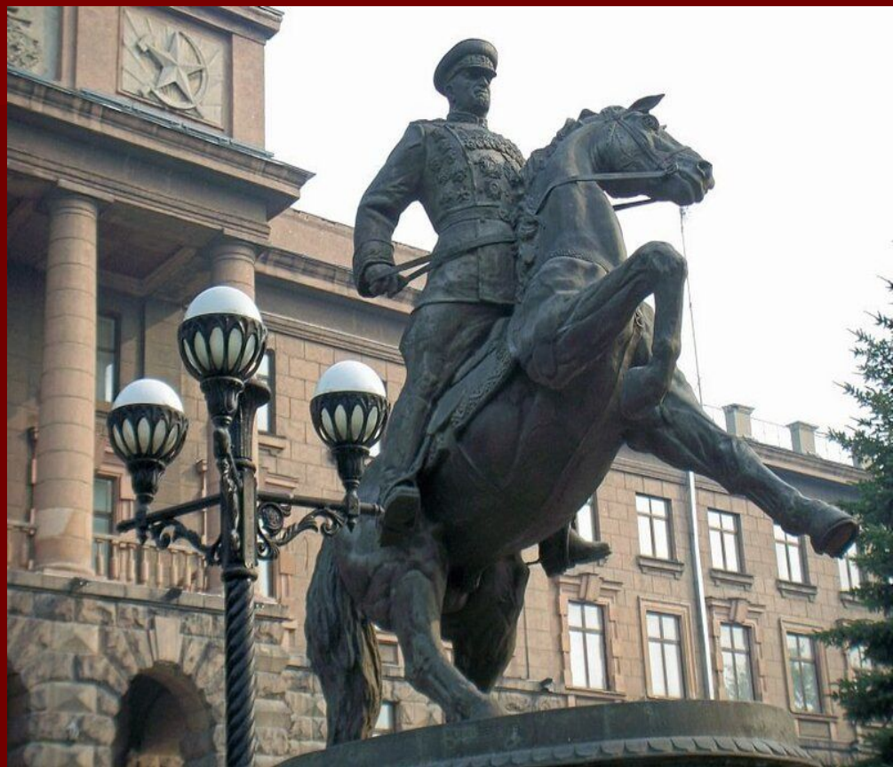
Памятник Жукову в Екатеринбурге возле штаба УрВО