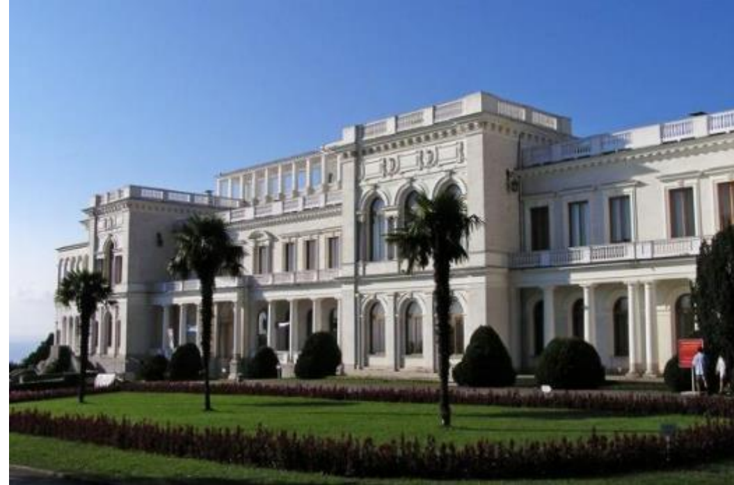
Ливадийский дворец - южная резиденция российских императоров в Крыму.