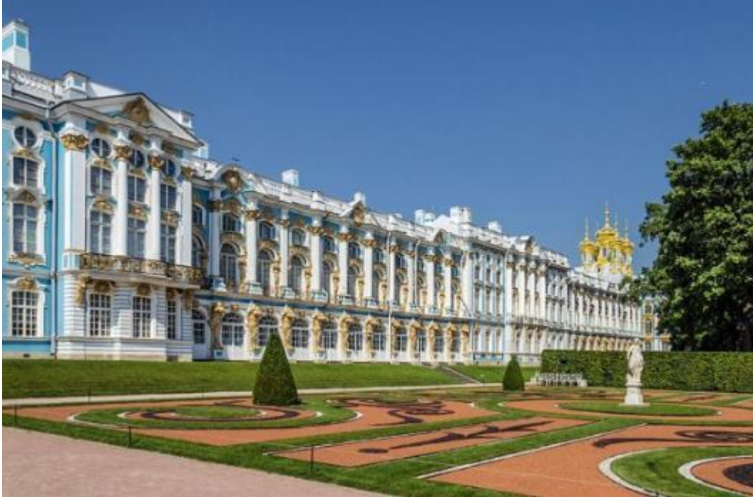
Большой Екатерининский дворец в Царском селе.