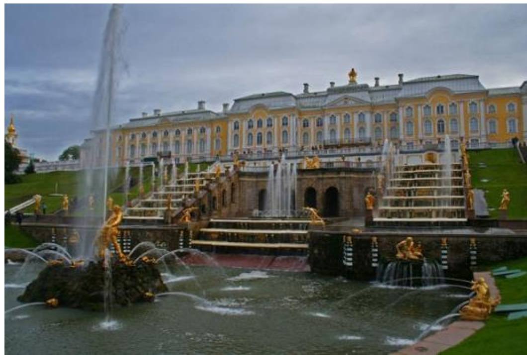
Петергофский дворец в Санкт-Петербурге.