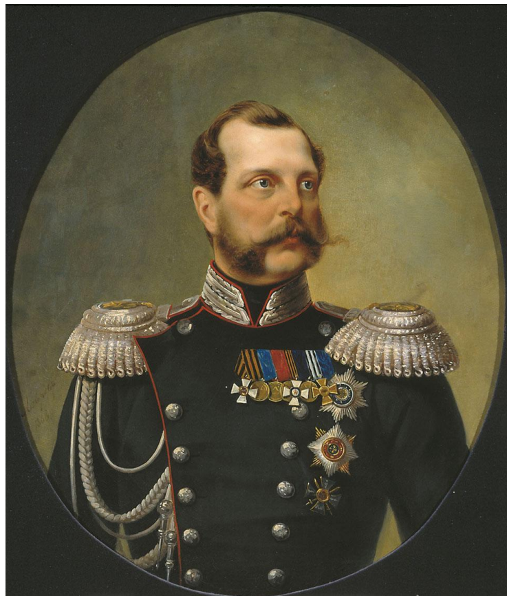
Александр II (1855-1881)