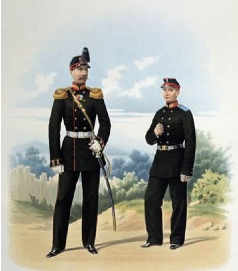
Форма офицера русской армии