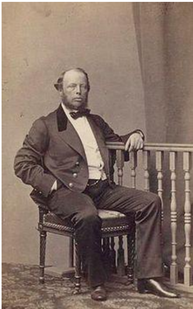
Министр финансов М. Х. Рейтерн