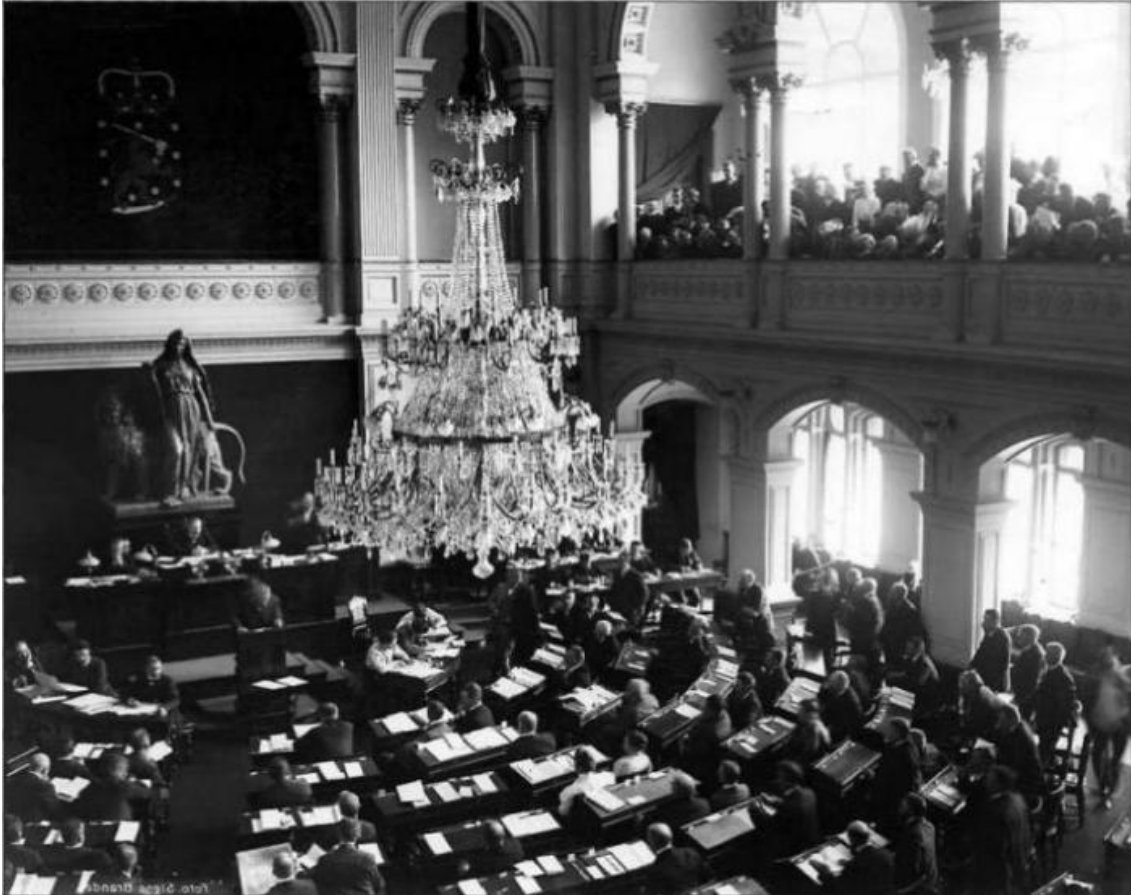
Университет в России 1863