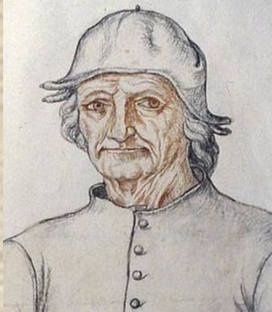
Ерун Антонисон ван Акен (Босха) около 1450 года-09.08.1516г.г.

Нидерландами в XV в. называли земли у берегов Северного моря, где теперь расположены Голландия и Бельгия. В XV в. впервые в европейском искусстве бытовой жанр становится самостоятельным направлением в живописи. У нидерландских художников не было стремления к идеализации, героизации, возвеличиванию человека и его деяний. Напротив, их отличали пристальный взгляд на мир и его правдивое, непосредственное изображение, уважение к будничной жизни и любовь к миру вещей. Все это привело к появлению картин на бытовые темы. Особое место в формировании и утверждении этого жанра принадлежит Босху и Брейгелю.