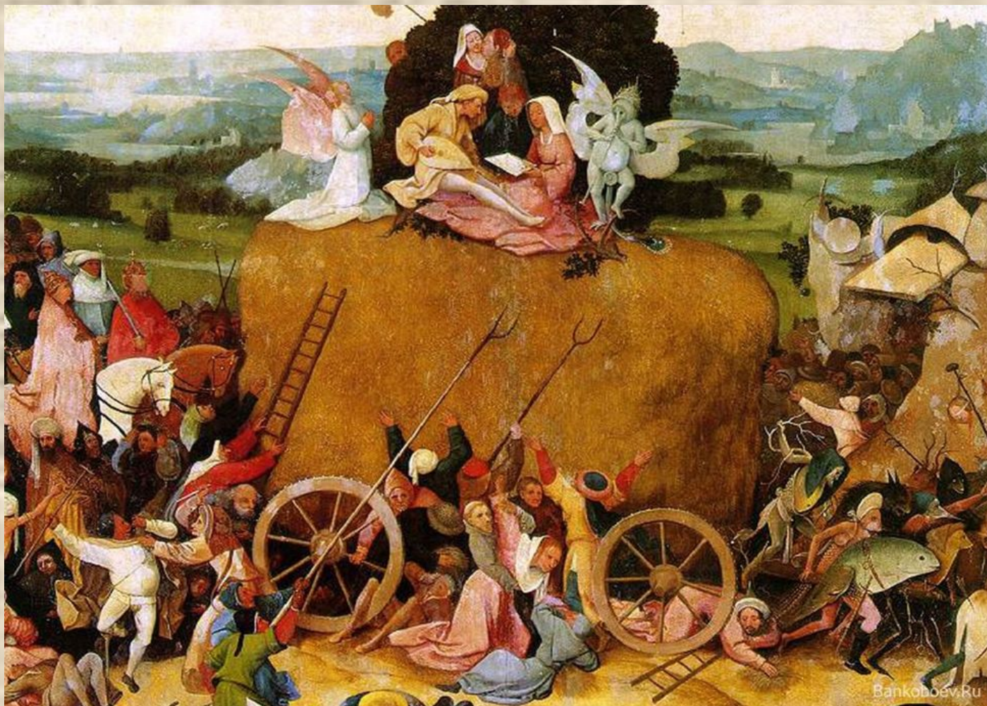
И. Босх. Воз сена