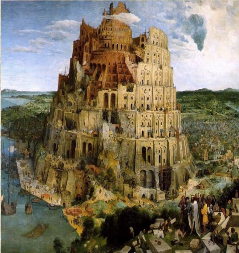
П. Брейгель «Вавилонская башня»

Эпоха Возрождения была прежде всего духовным явлением. Она стала поворотным пунктом в эволюции западной культуры и цивилизации. Она означала начало новой тенденции — тенденции от культуры к цивилизации.