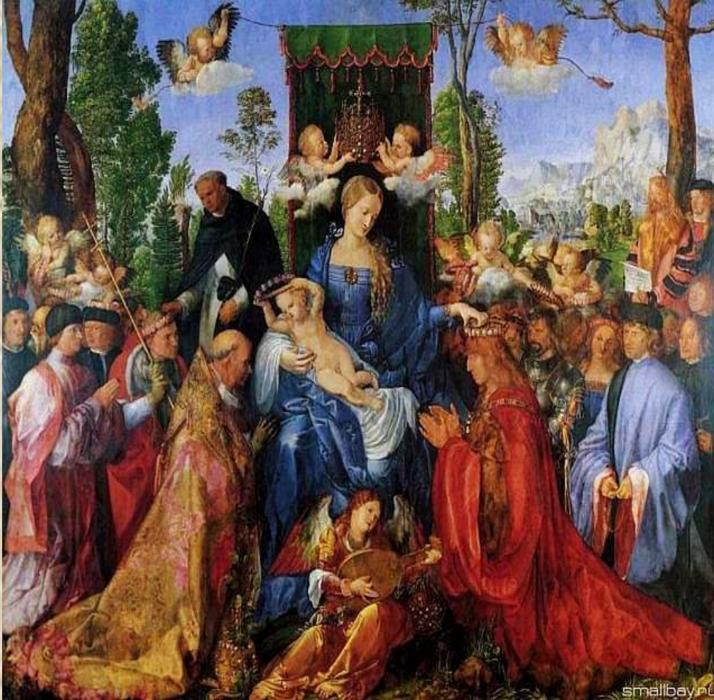
Дюрер Альбрехт, картина "Праздник гирлянд роз"

Альбрехт Дюрер был основоположником немецкого Возрождения и единственной универсальной фигурой, подобной итальянским титанам Ренессанса.