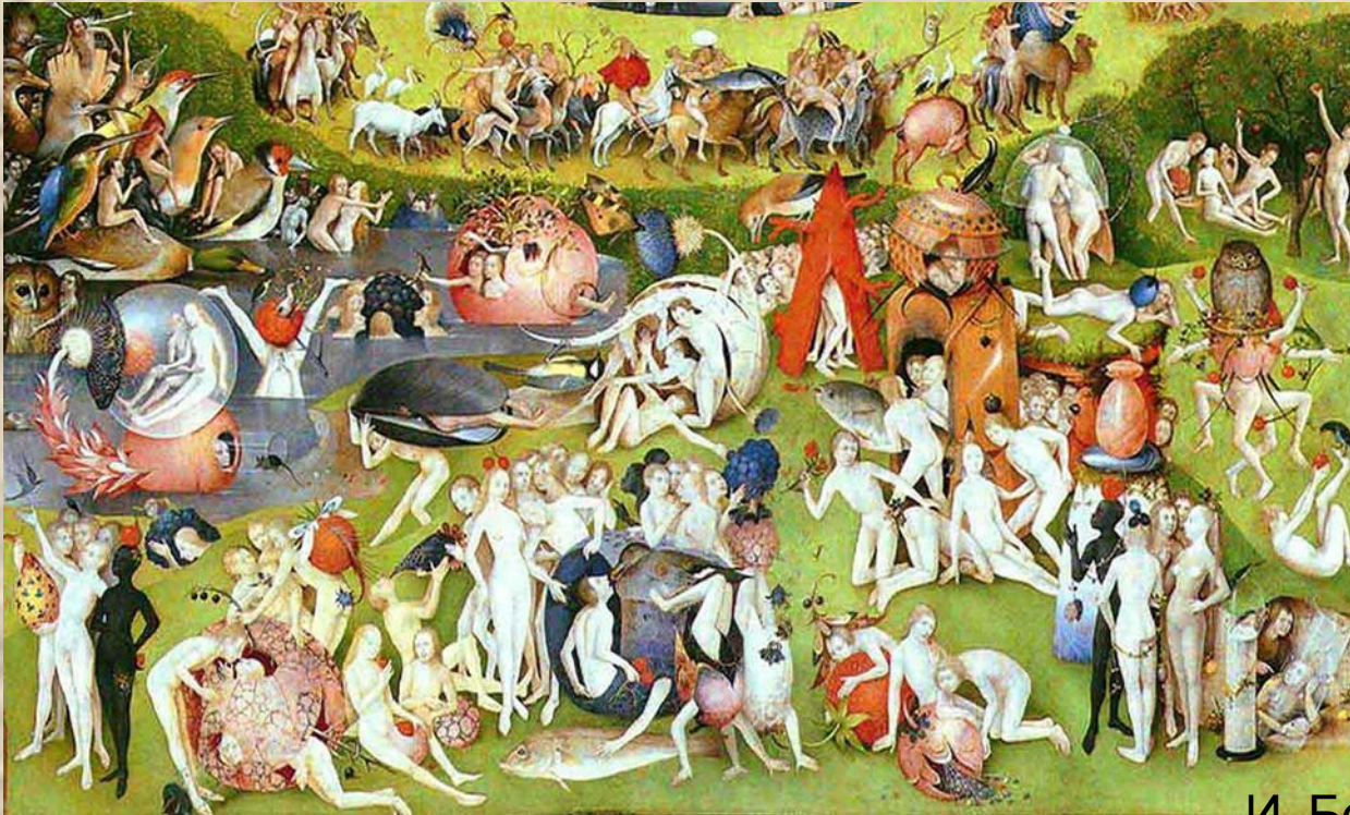
И. Босх Сад земных наслаждений

Босх на своих полотнах создает множественное, раздробленное пространство. В то время как итальянцы чтут совершенство в природе, Босх отказывает ему. Отличается от итальянских мастеров он и тем, что совершенно не рассчитывает перспективу, она у него интуитивна. Кроме того, в его изобразительных произведениях отсутствует акцентирование центра композиции, и пространство всегда подается с высоким горизонтом. И, конечно, прежде всего, творчество этого художника отличается неподражаемой фантазией, изобретательностью, способностью создавать характерные, полные символического смысла образы.