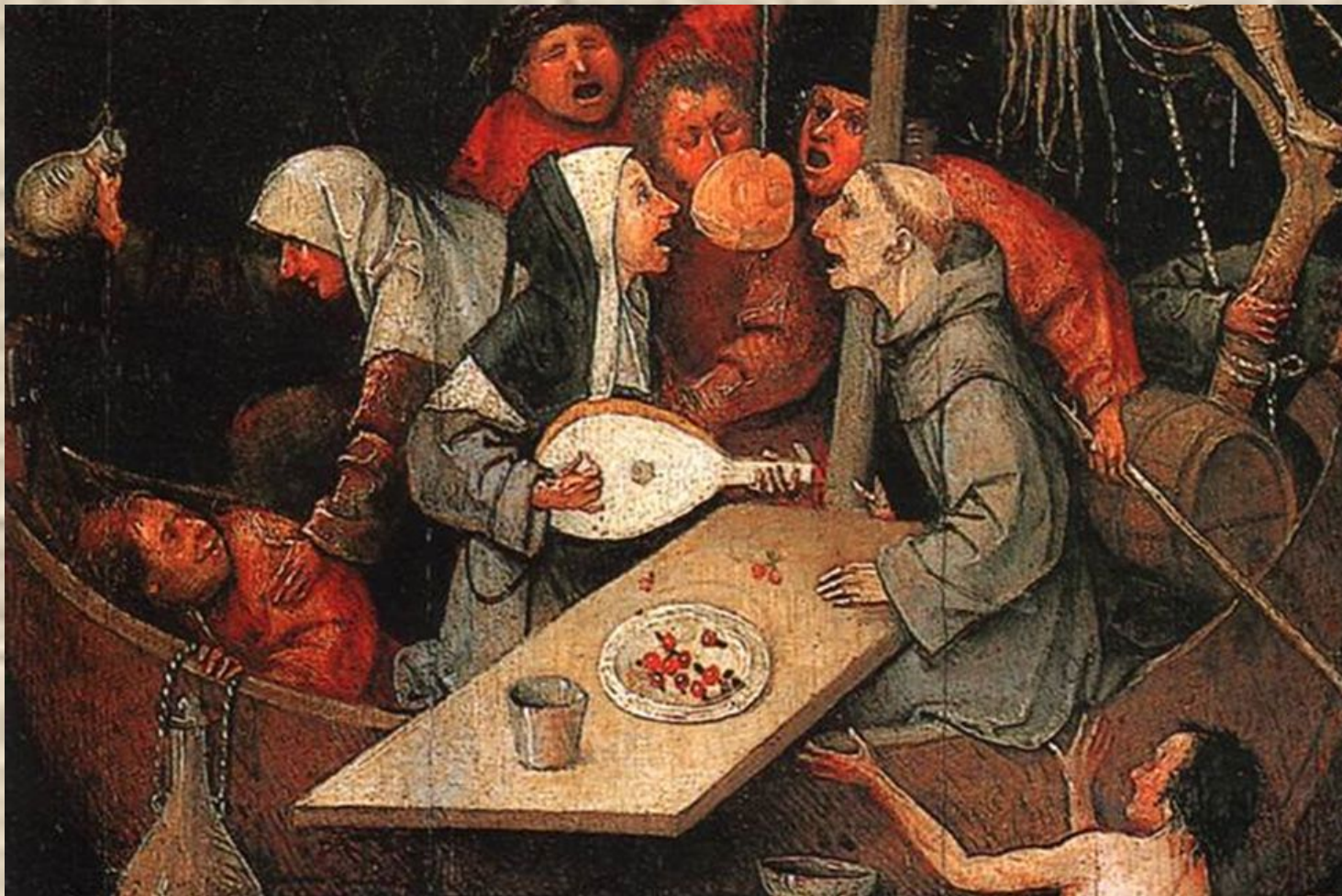
И. Босх. Корабль дураков