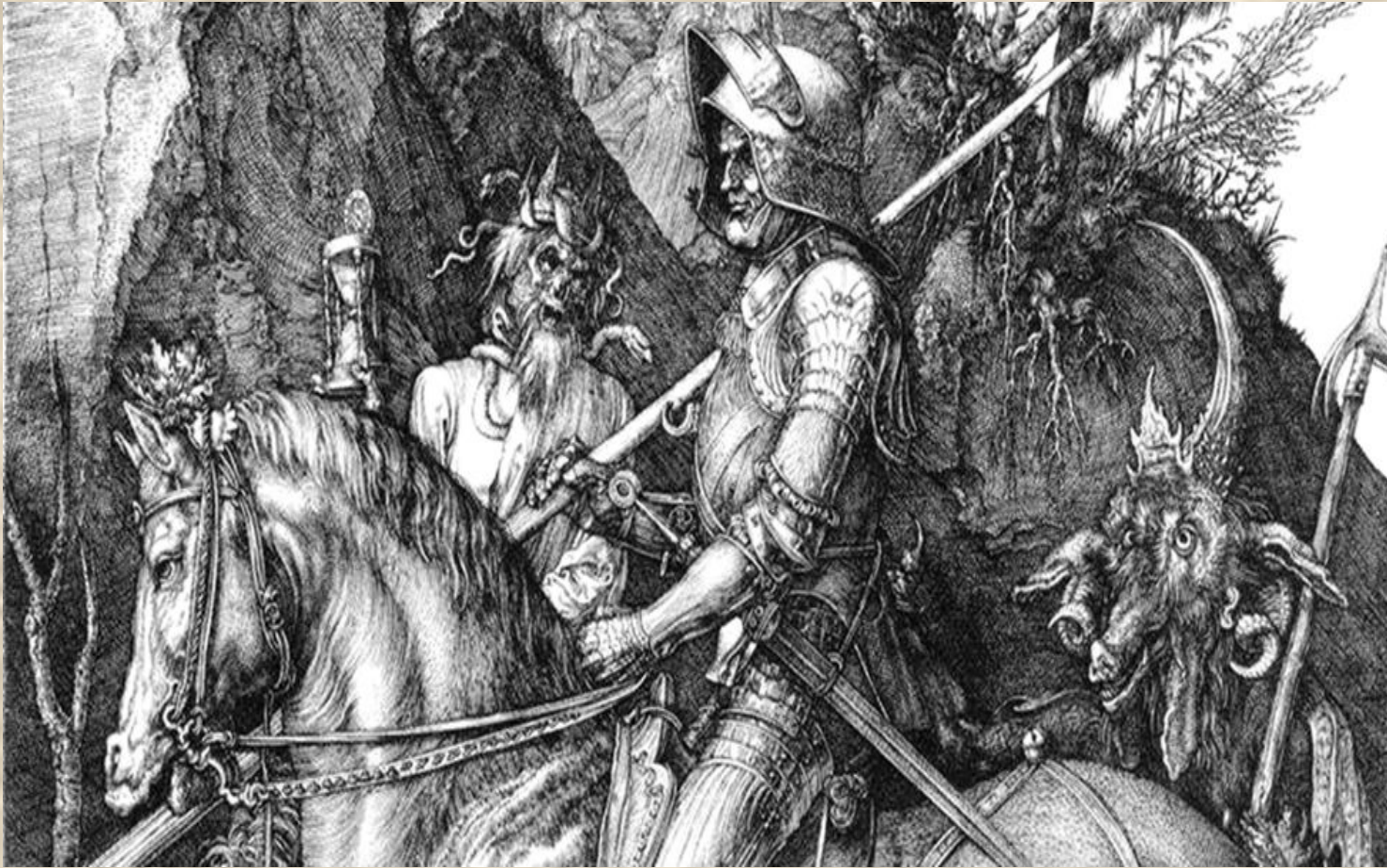
А. Дюрер. Рыцарь, смерть и дьявол.