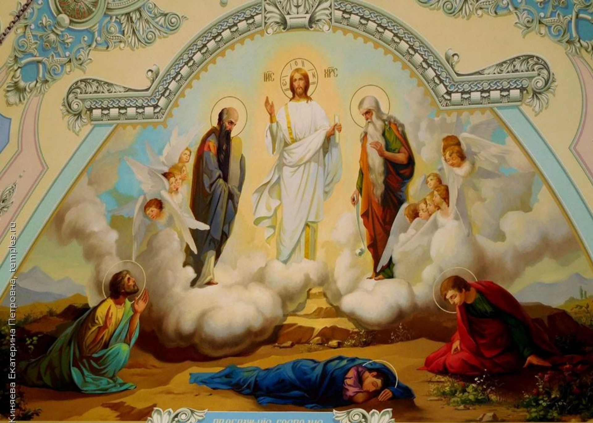
ПР. ОБРАЖЕНІЕ ГОСПОДНЕ