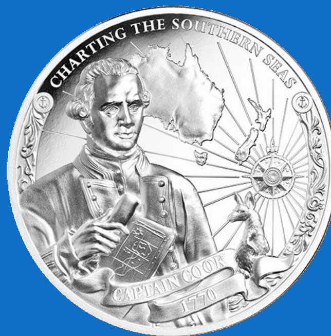
Монета с островов Кука