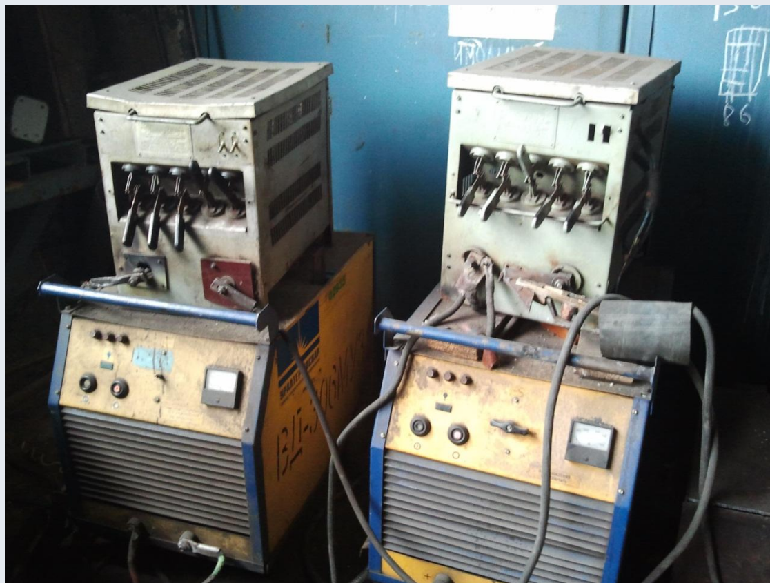
Сварочный выпрямитель ВД – 306 МУЗ