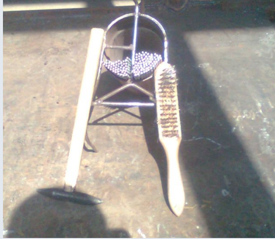
Электроды, МОЛОТОК ДЛЯ ОЧИСТКИ ШВА ОТ шлаков, металлическая щётка