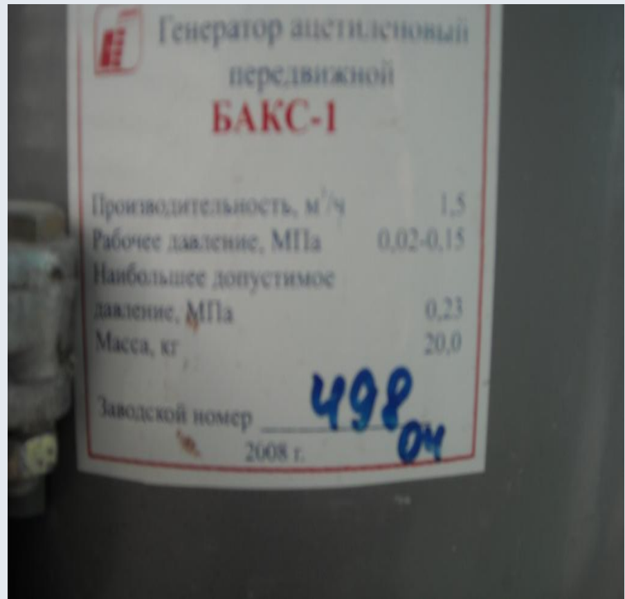
Ацетиленовый генератор передвижной