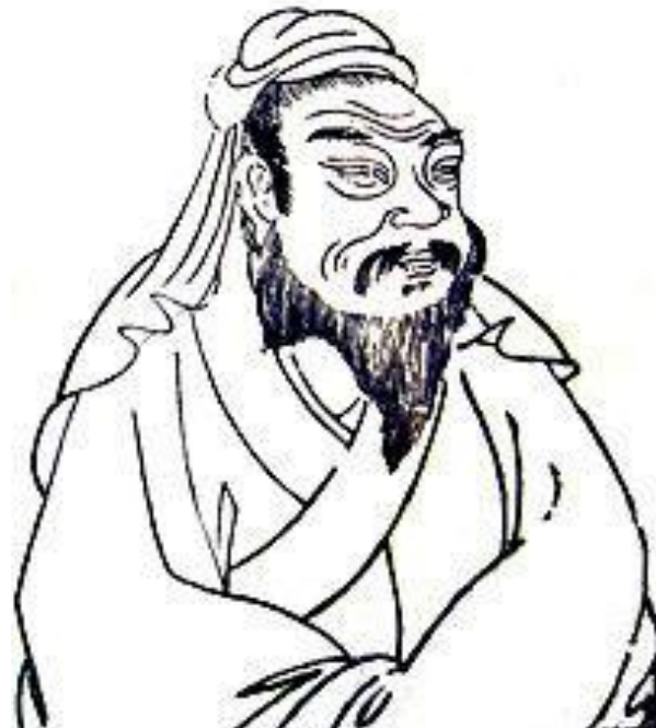
周 公 像