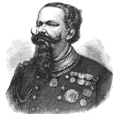
Виктор Эммануил II

Депутаты избирались из 2% жителей страны (мужчин старше 25 лет + имущественный ценз).