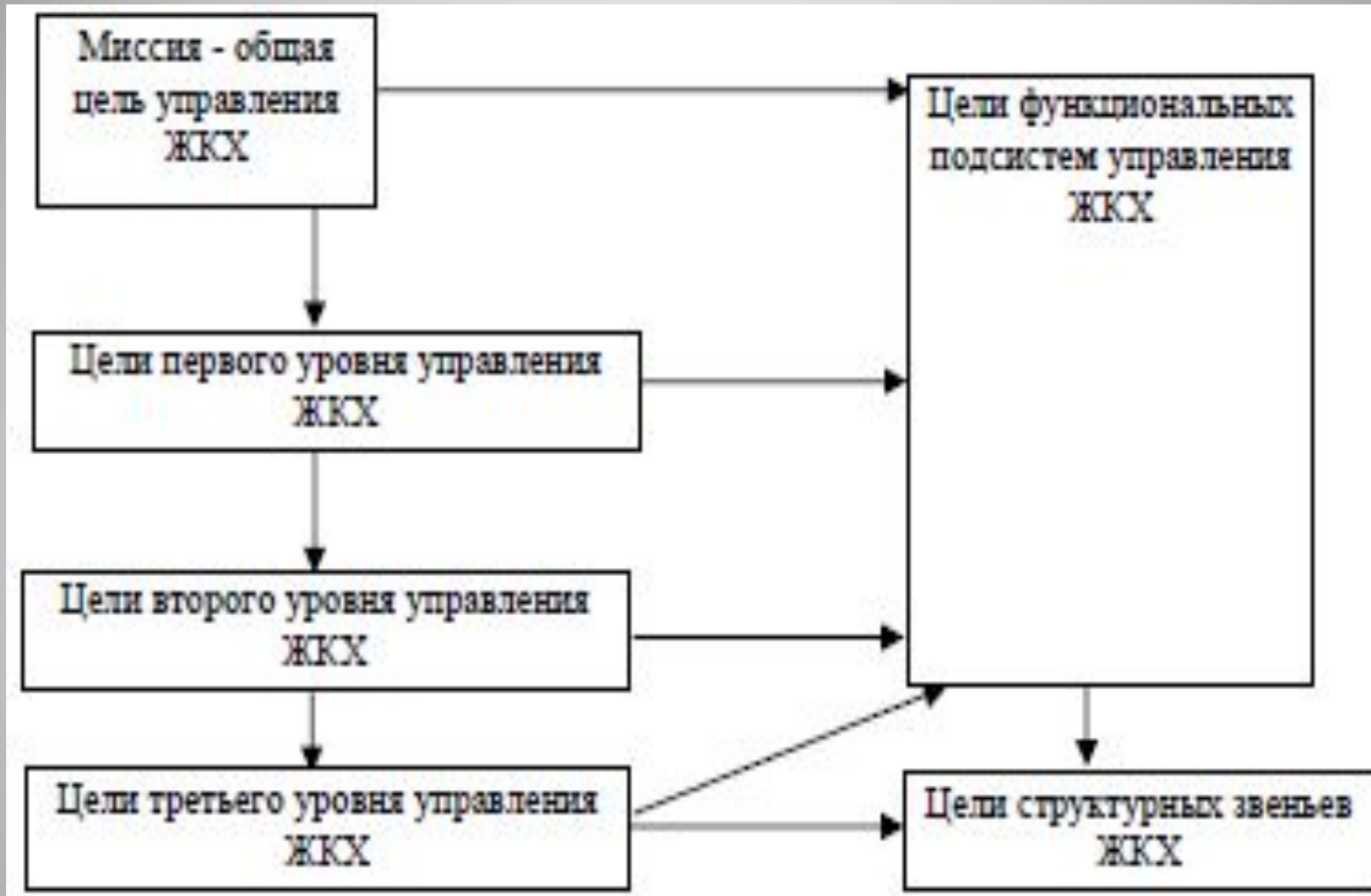
«Дерево целей» в системе управления жилищным хозяйством (ЖХ)