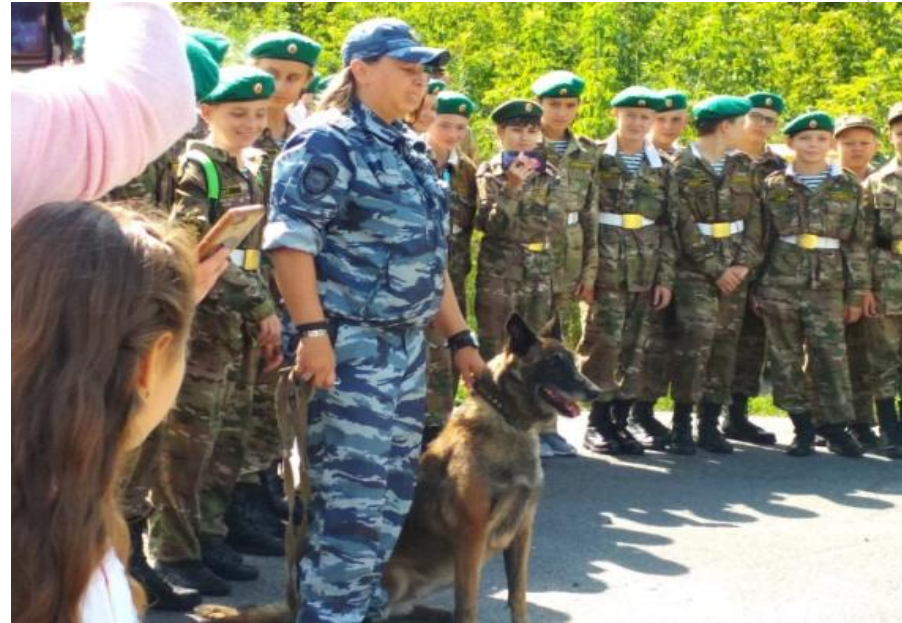
День фронтовой собаки