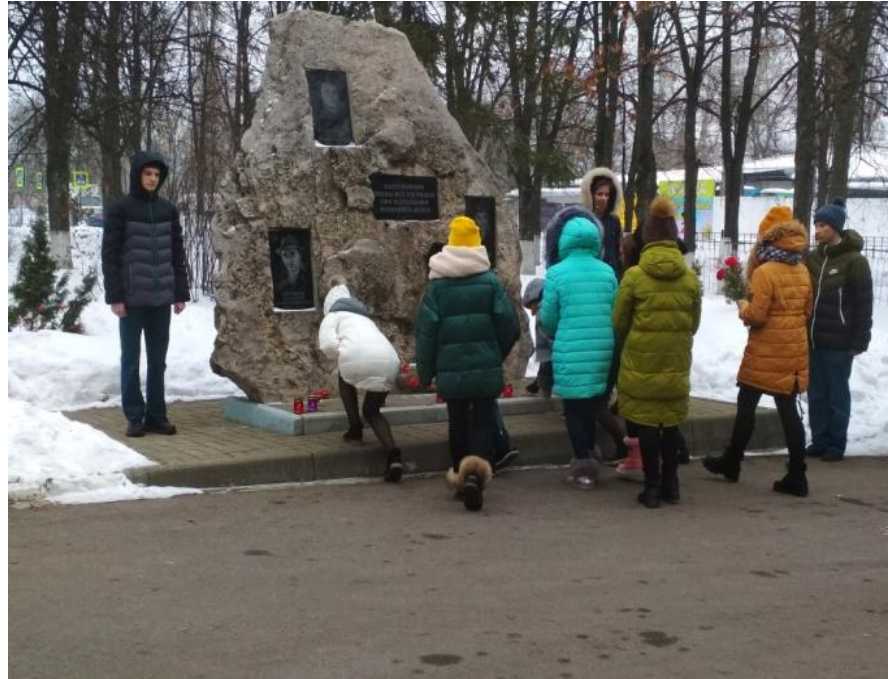
Акция «Огонек памяти»