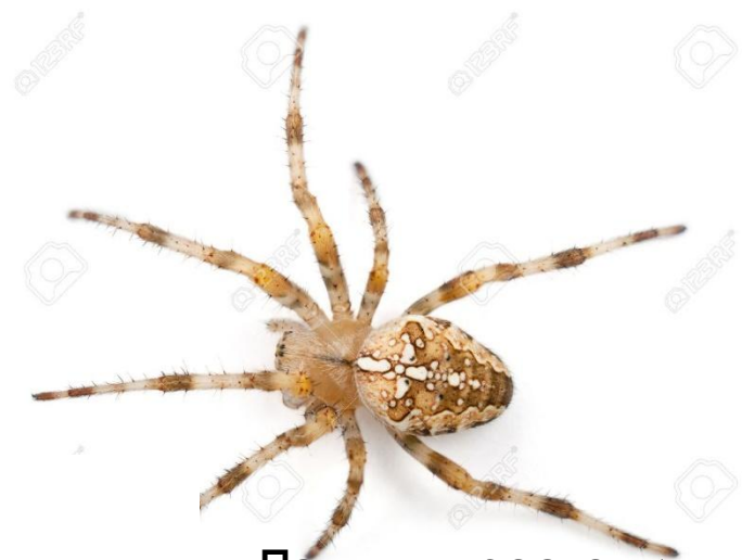
Павук - хрестовик