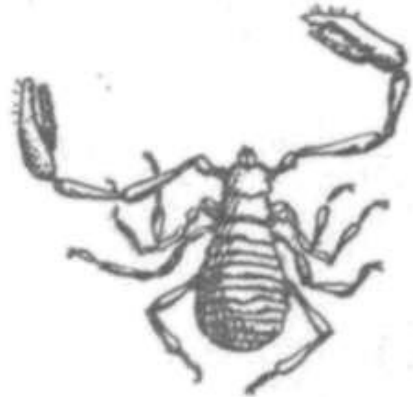
Псевдоскорпіони. Книжковий псевдо- скорпіон.