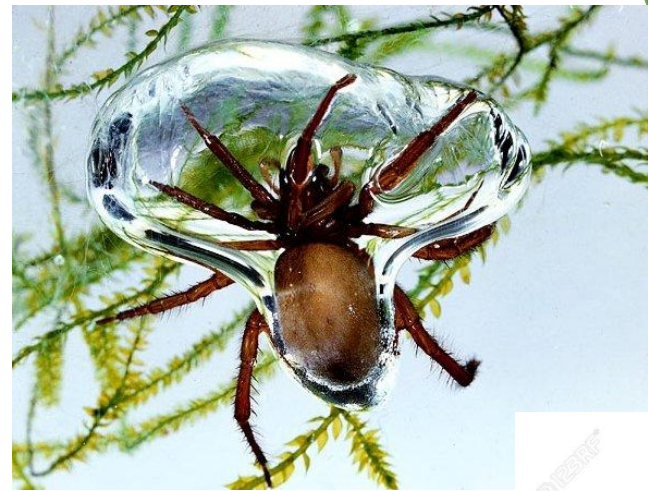
Павук - сріблянка