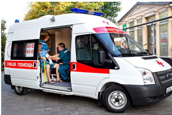
Бесплатная система здравоохранения