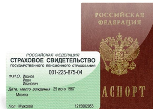
Социальное обеспечение и страхование