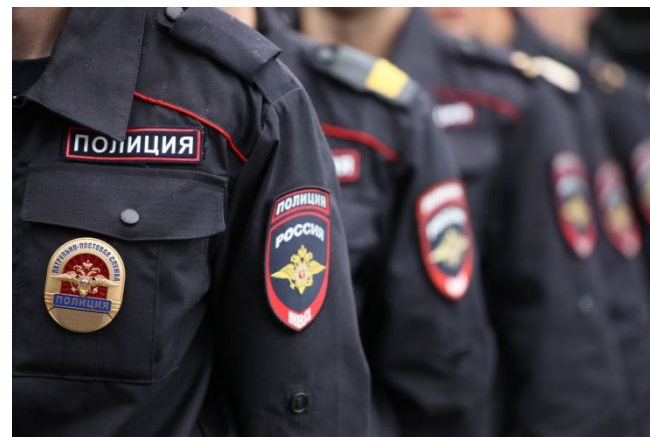
Внутренняя безопасность государства