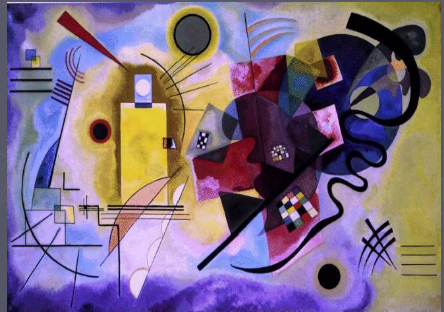
"Нижнє сходження" (1934)