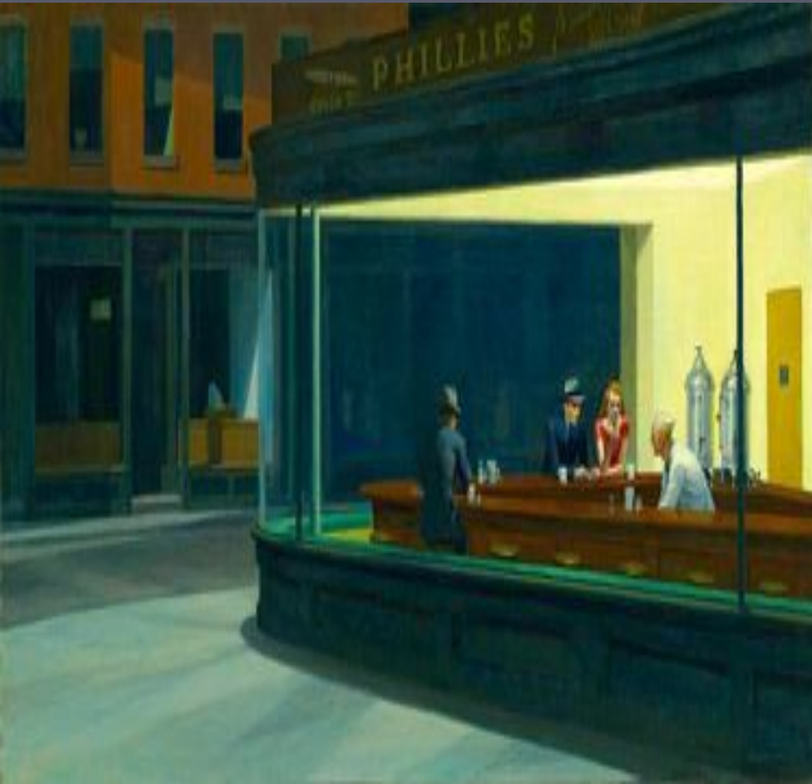
Едварт Хуппер "Нічний візник" (1942)