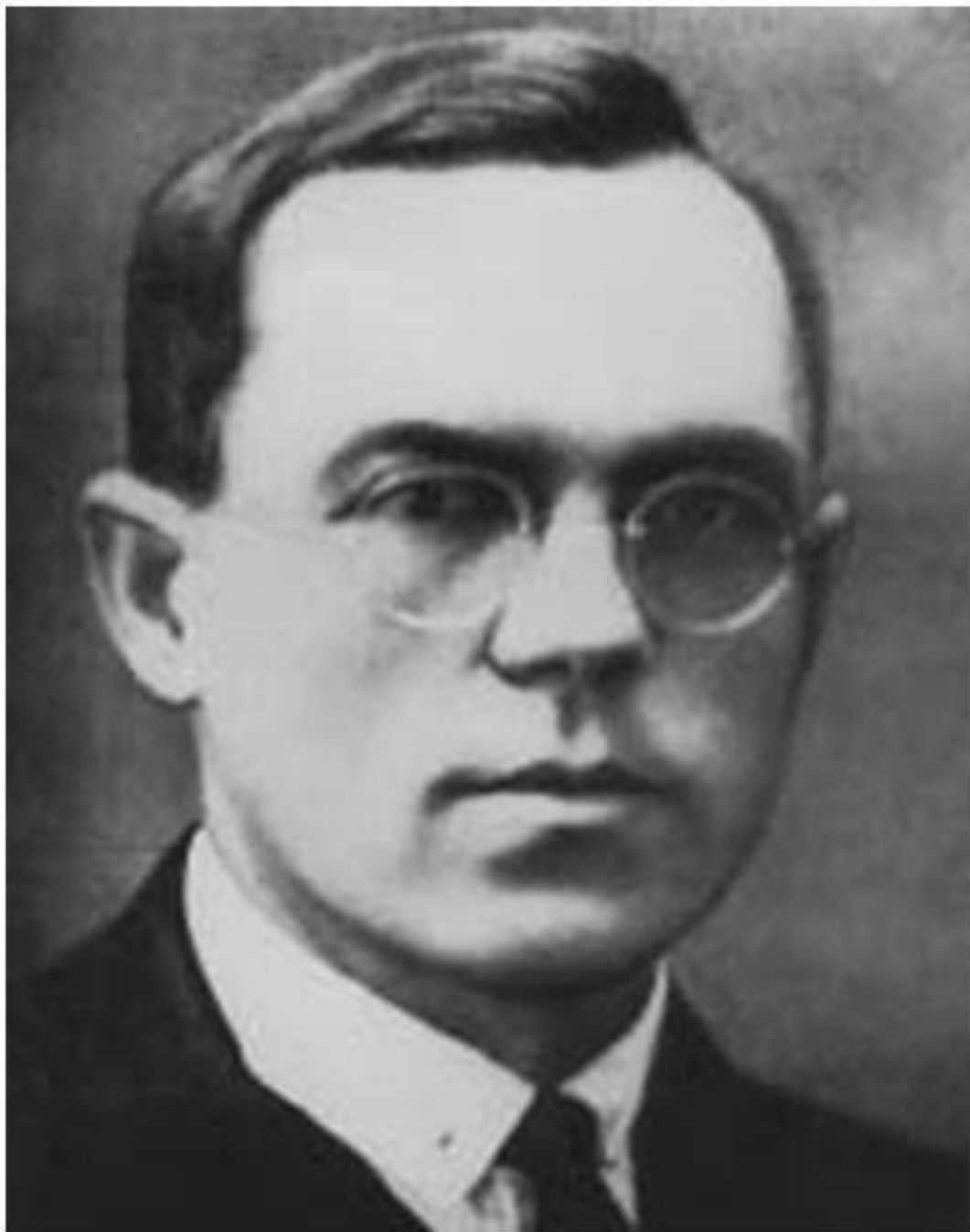
Кондратьев Николай Дмитриевич (1892-1938)