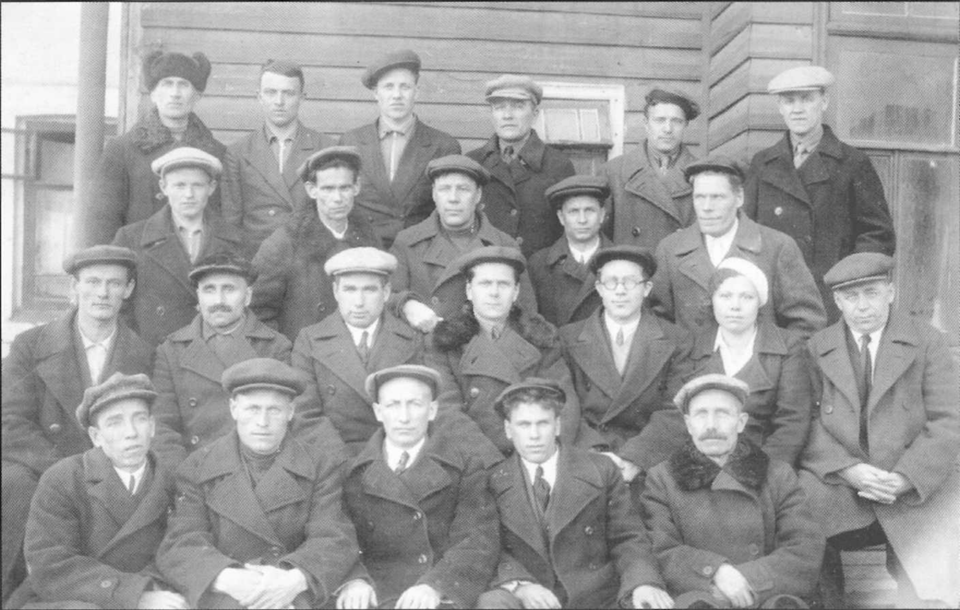
Участники кустового совещания управляющих отделений Госбанка СССР Вологодской области в 1939 году.