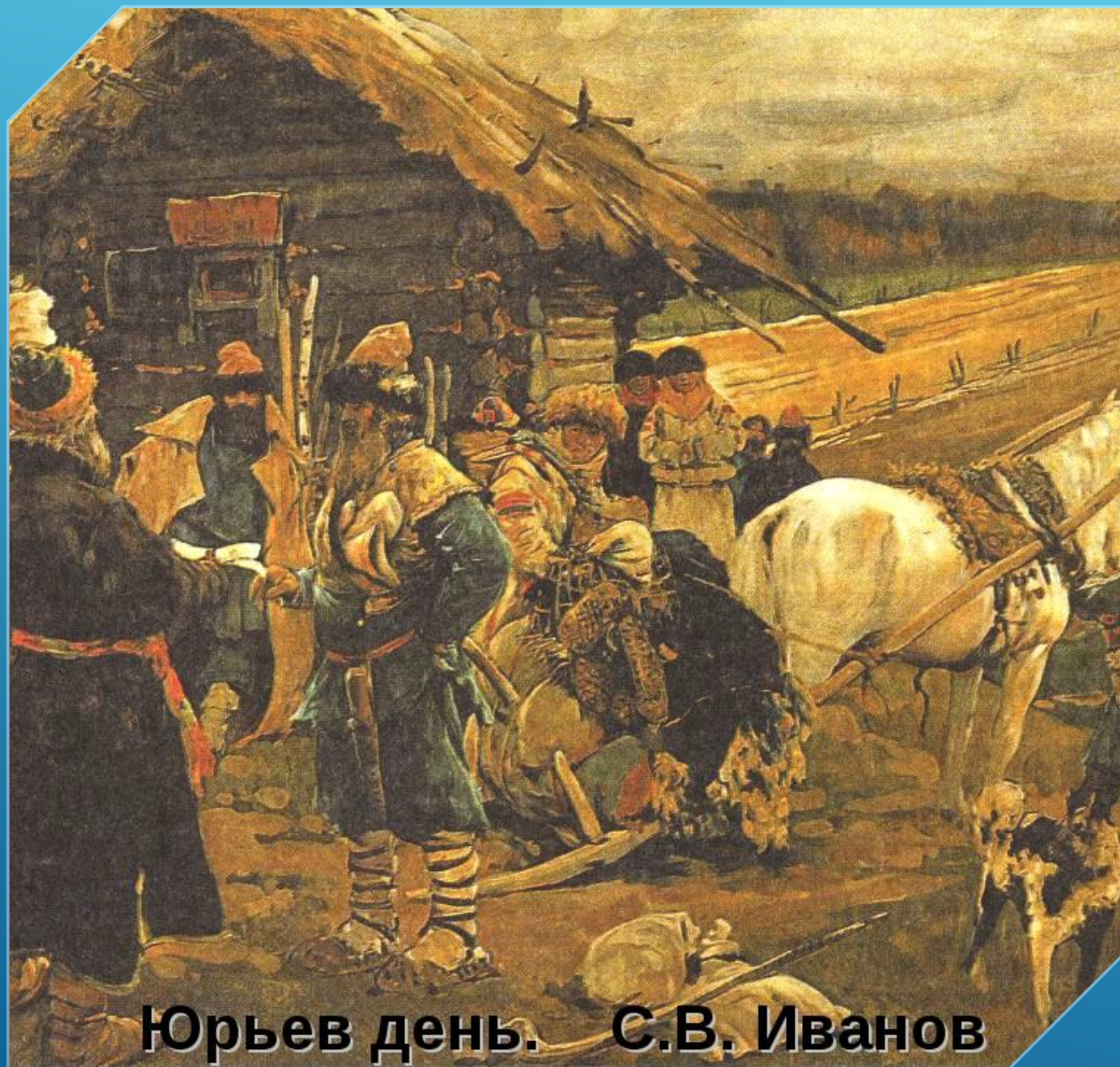
Юрьев день. С.В. Иванов