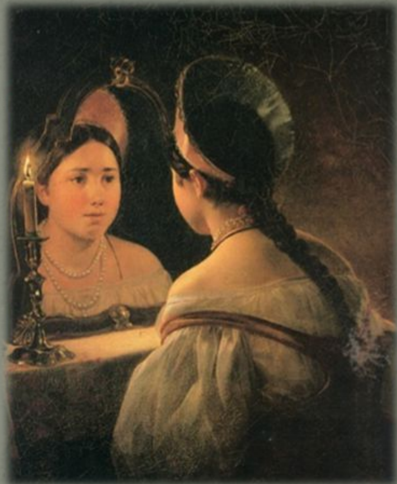
Карл Брюллов «Гадающая Светлана» Коллекция Нижегородского

Вот в светлице стол накрыт Белой пеленою; И на том столе стоит Зеркало с свечою; Два прибора на столе. «Загадай, Светлана; В чистом зеркала стекле В полночь, без обмана