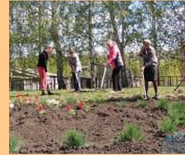
Благоустройство пришкольной территории