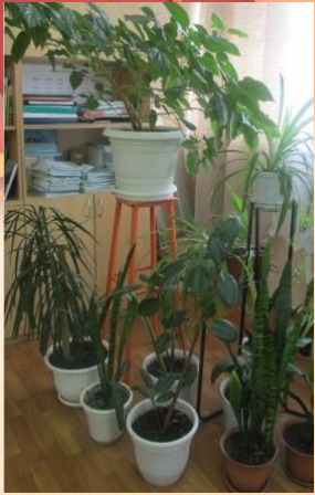
Озеленение школы и учебных кабинетов

В гимназии проведен комплекс мероприятий: