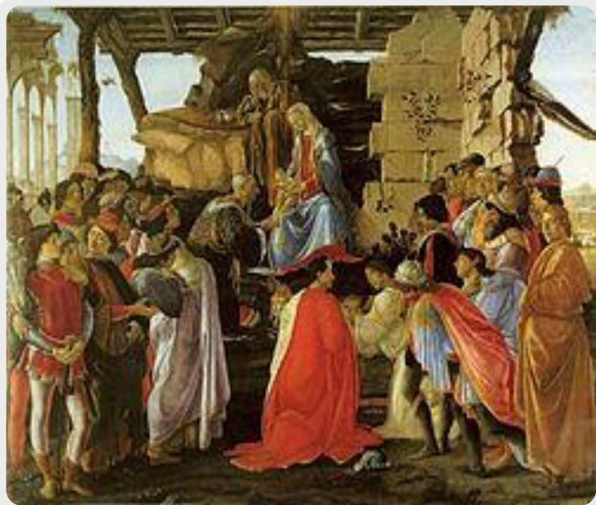
«Поклонение волхвов» (около 1475)