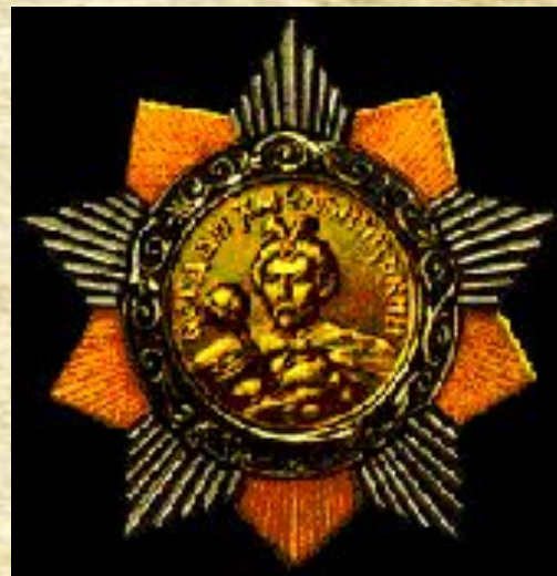
Орден Б. Хмельницкого