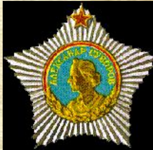
Орден А. Суворова