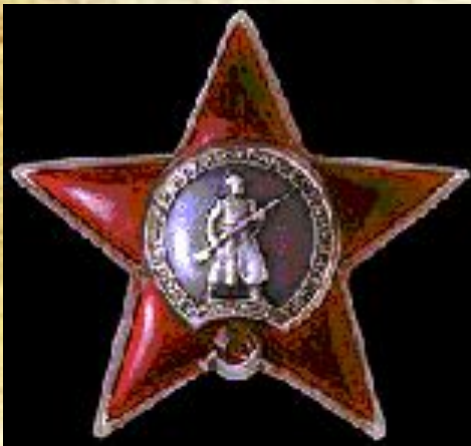
Орден Красная Звезда

Как называлась награда, которая вручалась при присвоении звания Героя Советского Союза?