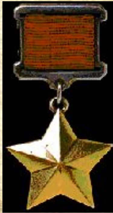
Медаль «Золотая Звезда»