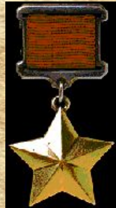
Медаль «Золотая Звезда»