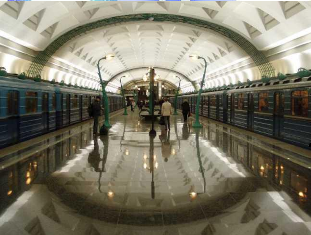
Схема метро похожа немножко На разноцветную «многоножку» Только, по правде, каждая «ножка» - Для электрички рельсо дорожка.