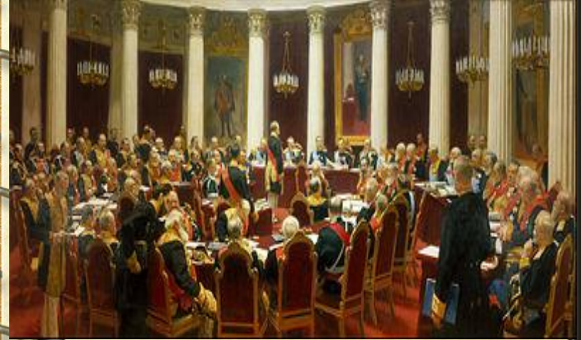
«Засідання Держ. Ради» (1901—1903).