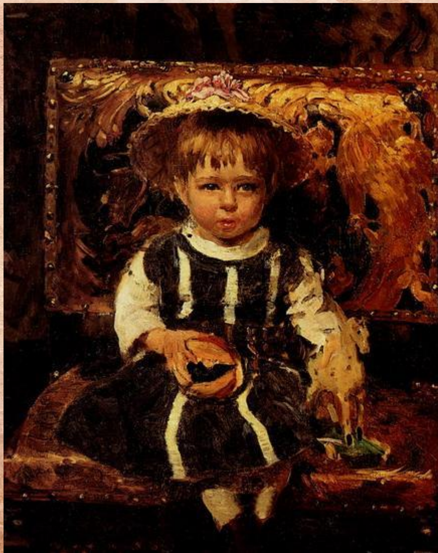
“Дочка Віра в дитинстві”