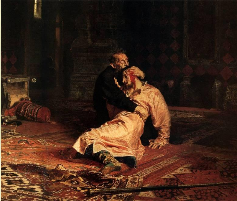
«Іван Грозний і син його Іван» (1881—1885)