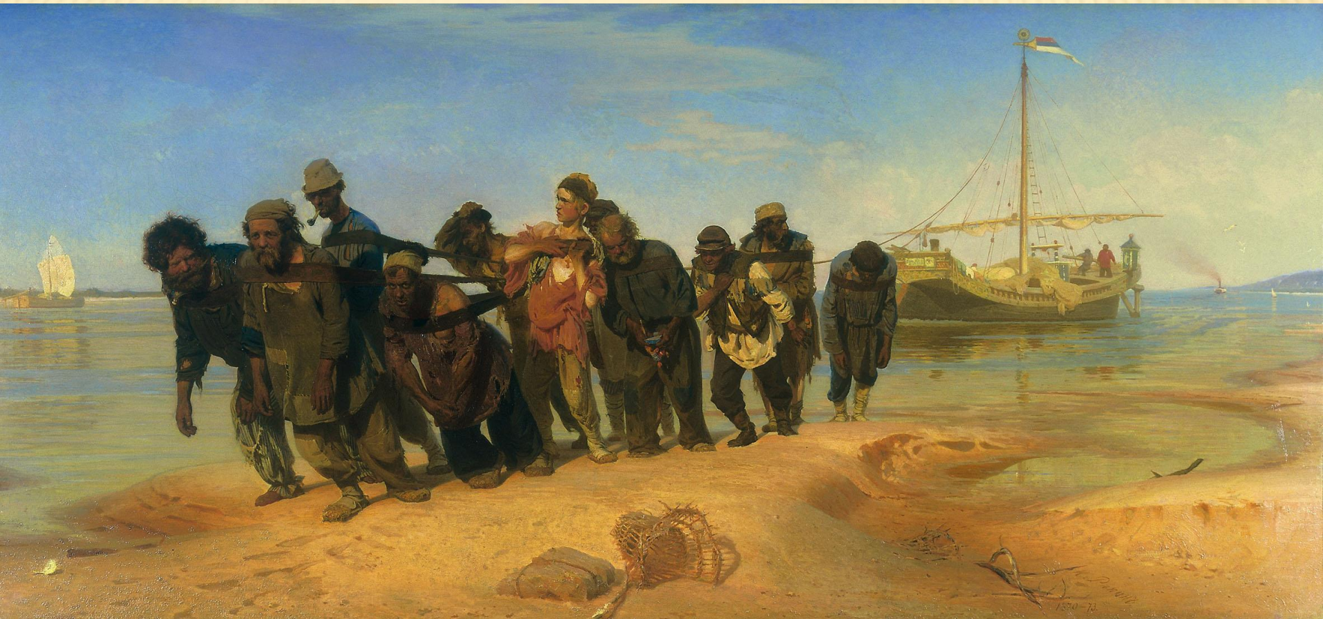
“Бурлаки на Волзі” 1870 – 1873 рр.