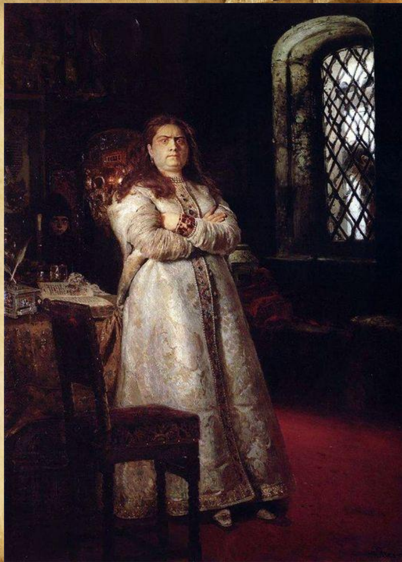
“Царівна Софія” 1879 р.