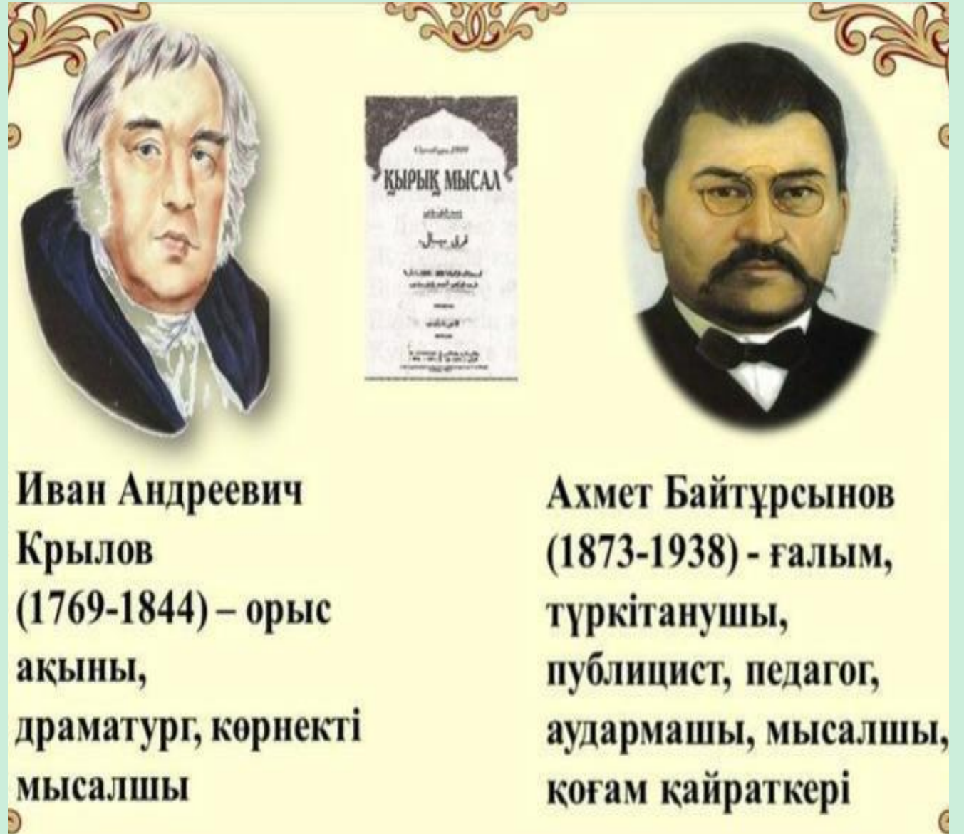
Иван Андреевич Крылов (1769-1844) – орыс ақыны, драматург, көрнекті мысалшы

Байтұрсынұлы Ахмет Алты томдық шығармалар жинағы. – Алматы: «Ел-шежіре», – 2013.