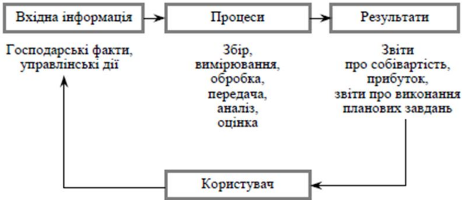
Рис. 1.1. Операційна модель інформаційної системи управлінського обліку