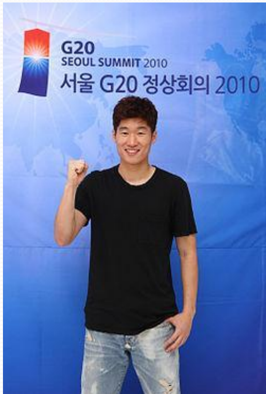
Пак Чи Сон – атақты футболшы