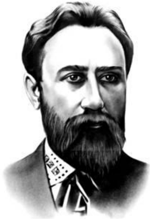
Борис Грінченко (1863—1910)