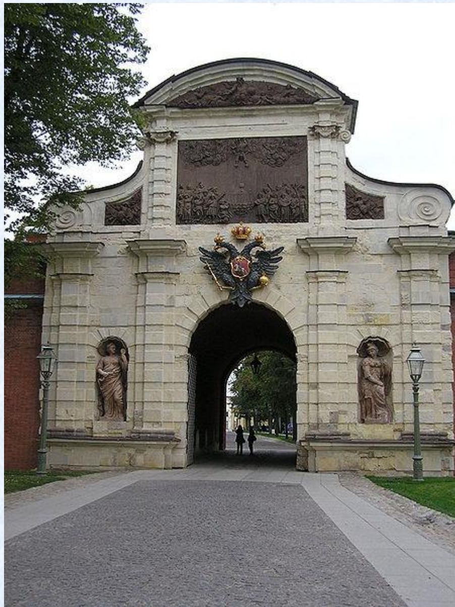
Д.Трезини. Петровские ворота. Петропавловская крепость.