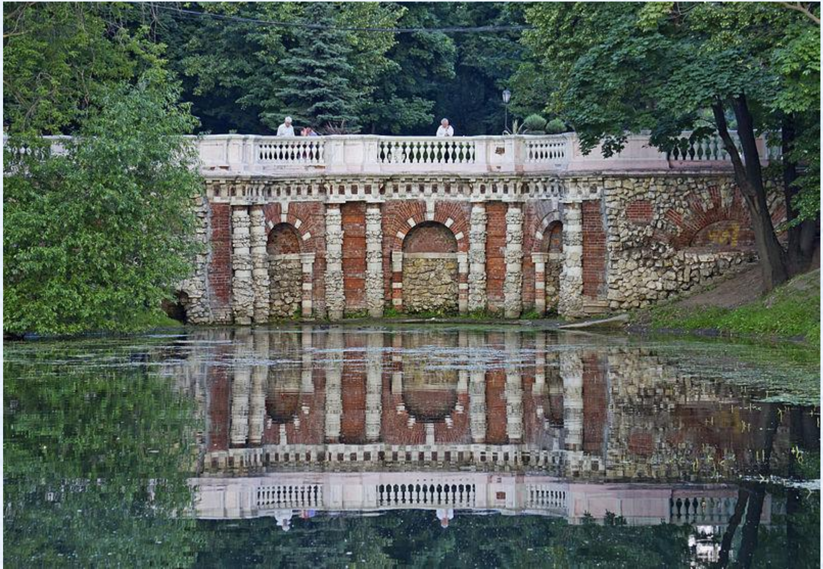
Грот у пруда. Лефортовский парк.