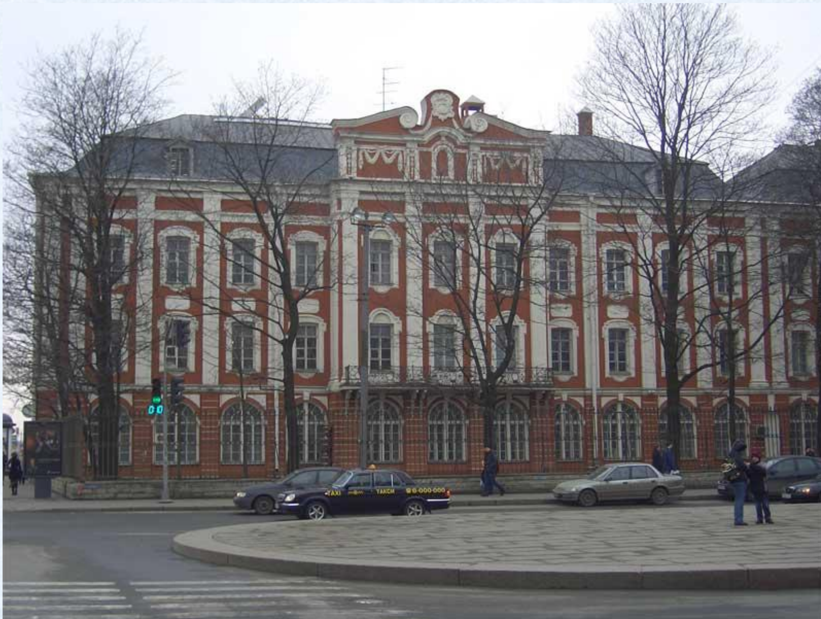
Д.Трезини. Здание Двенадцати коллегий. 1722-1742г.г.