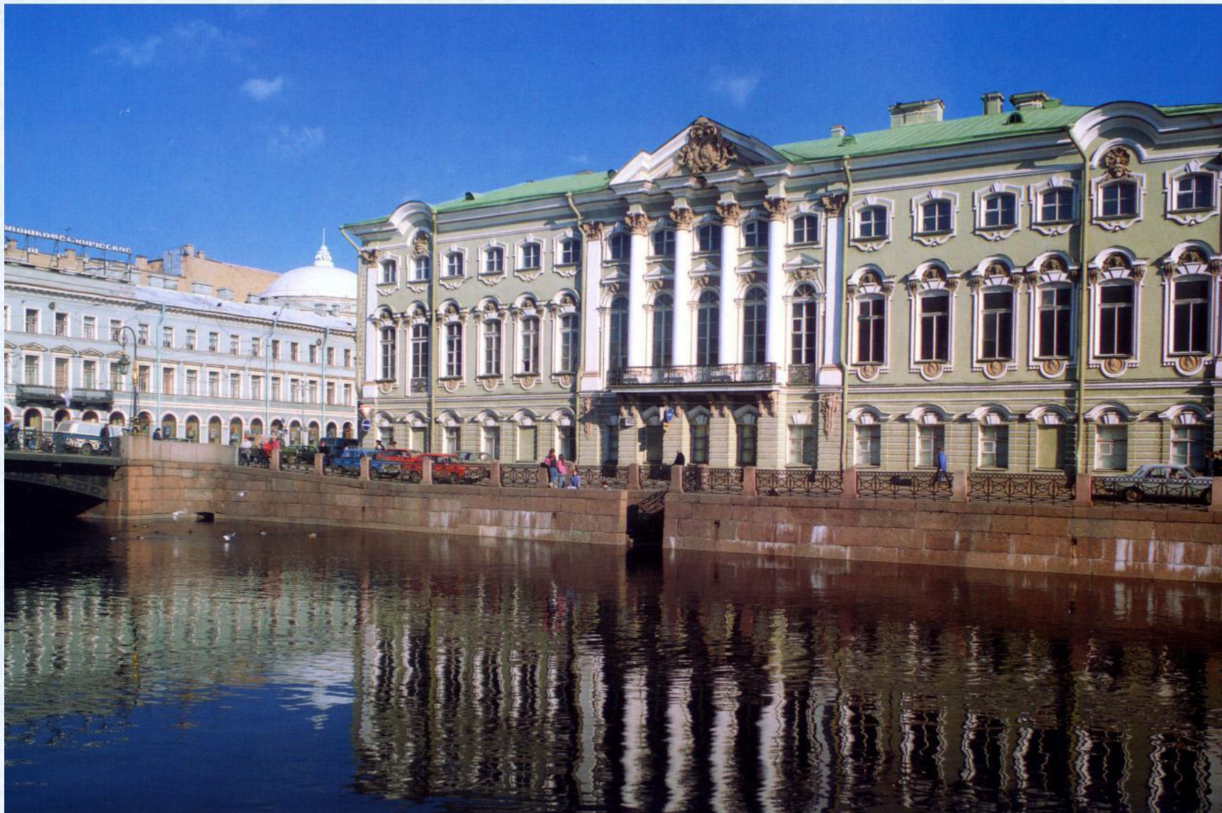
Дворец графов Строгановых 1754г.