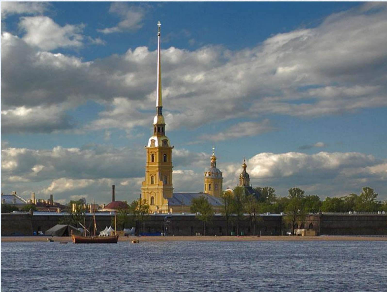
Д.Трезини. Петропавловская крепость.