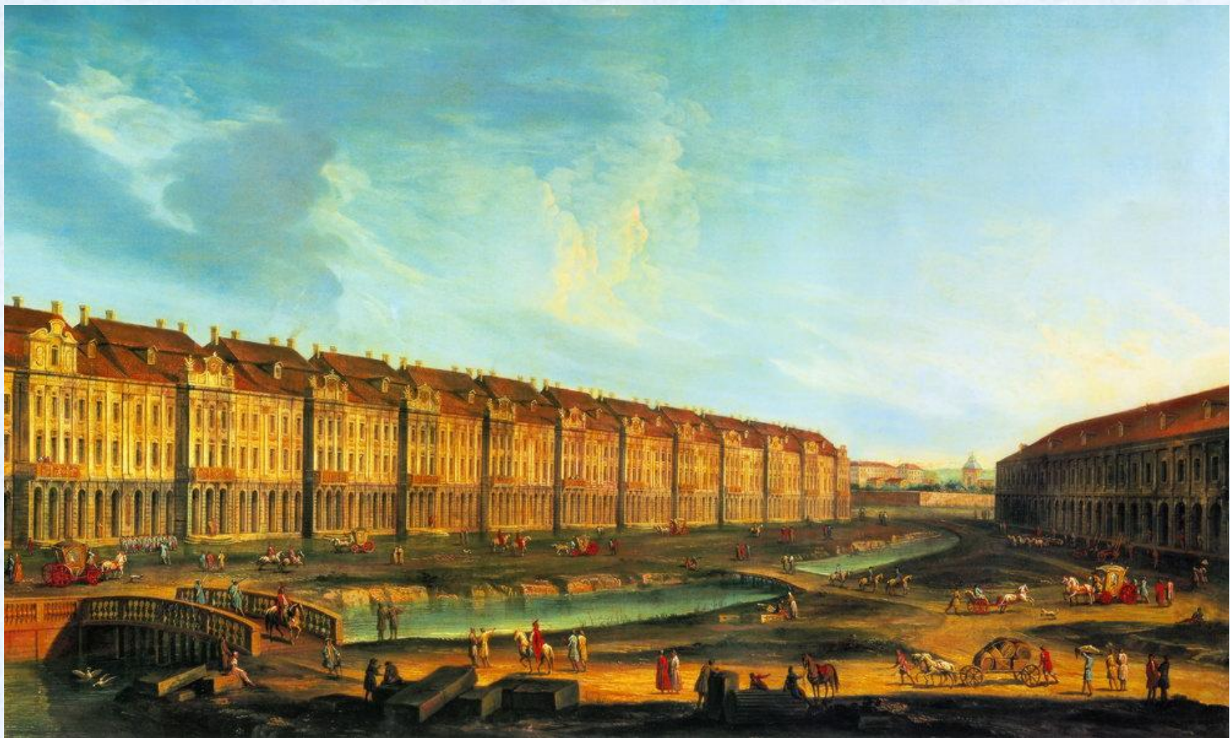
Неизвестный художник XVIII века. Здание Двенадцати коллегий.