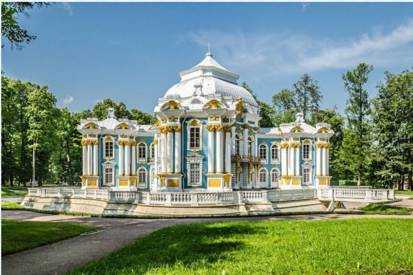
Павильон «Эрмитаж» в Царском селе.1747-1757г.г.