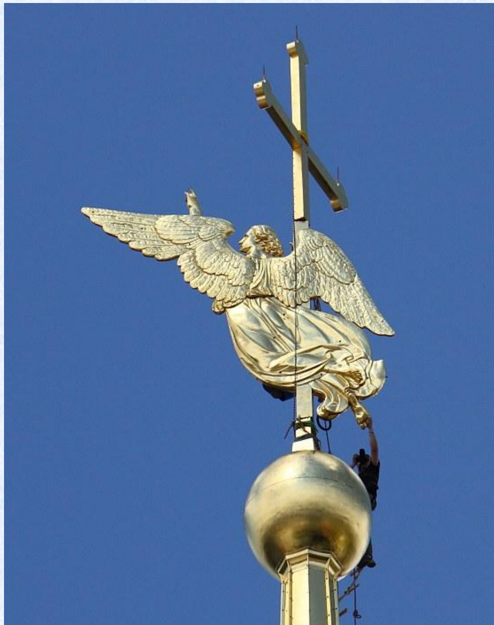
Шпиль Петропавловского собора