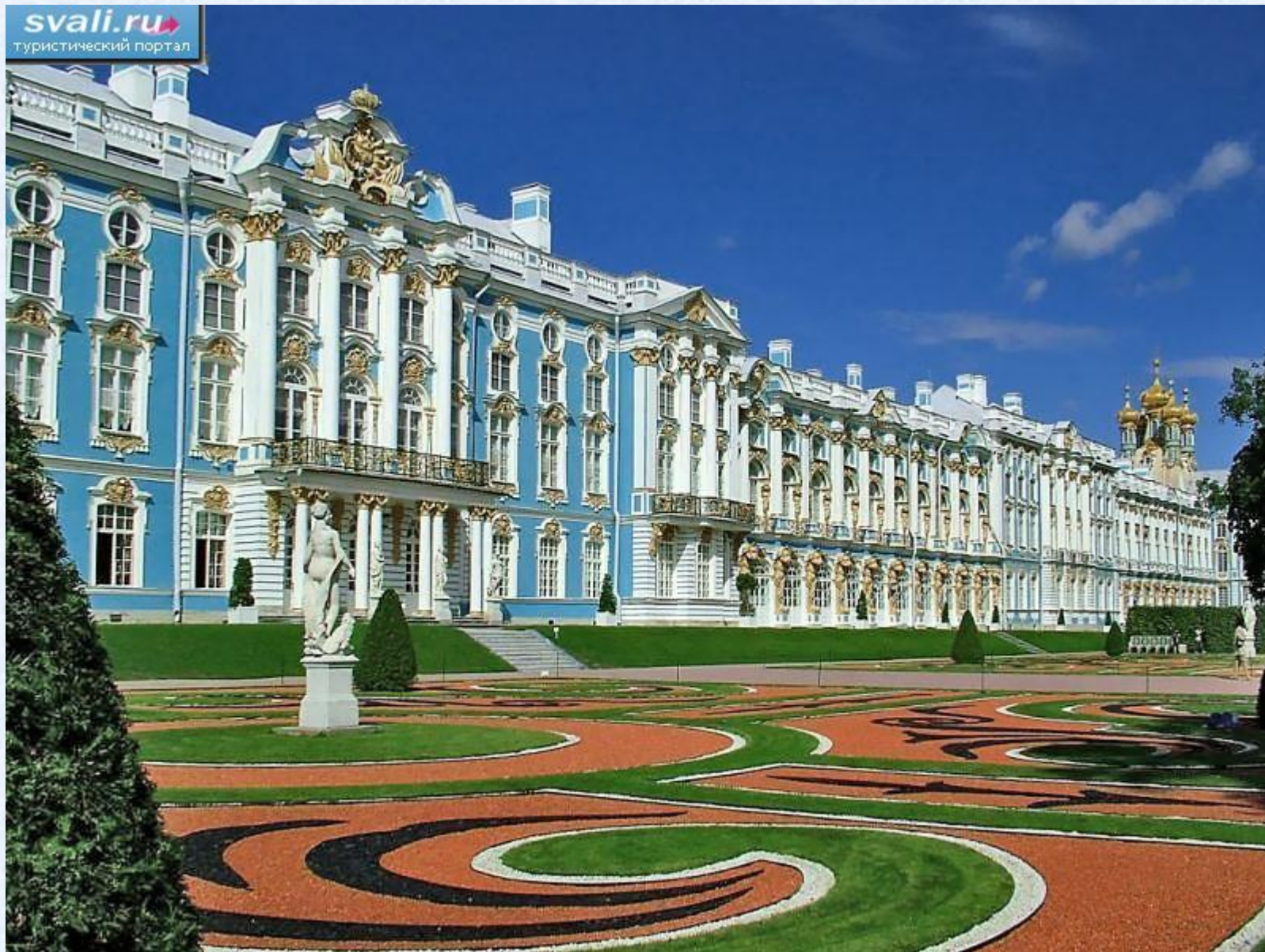
Екатерининский дворец (Царское Село). 1747-1757г.г.