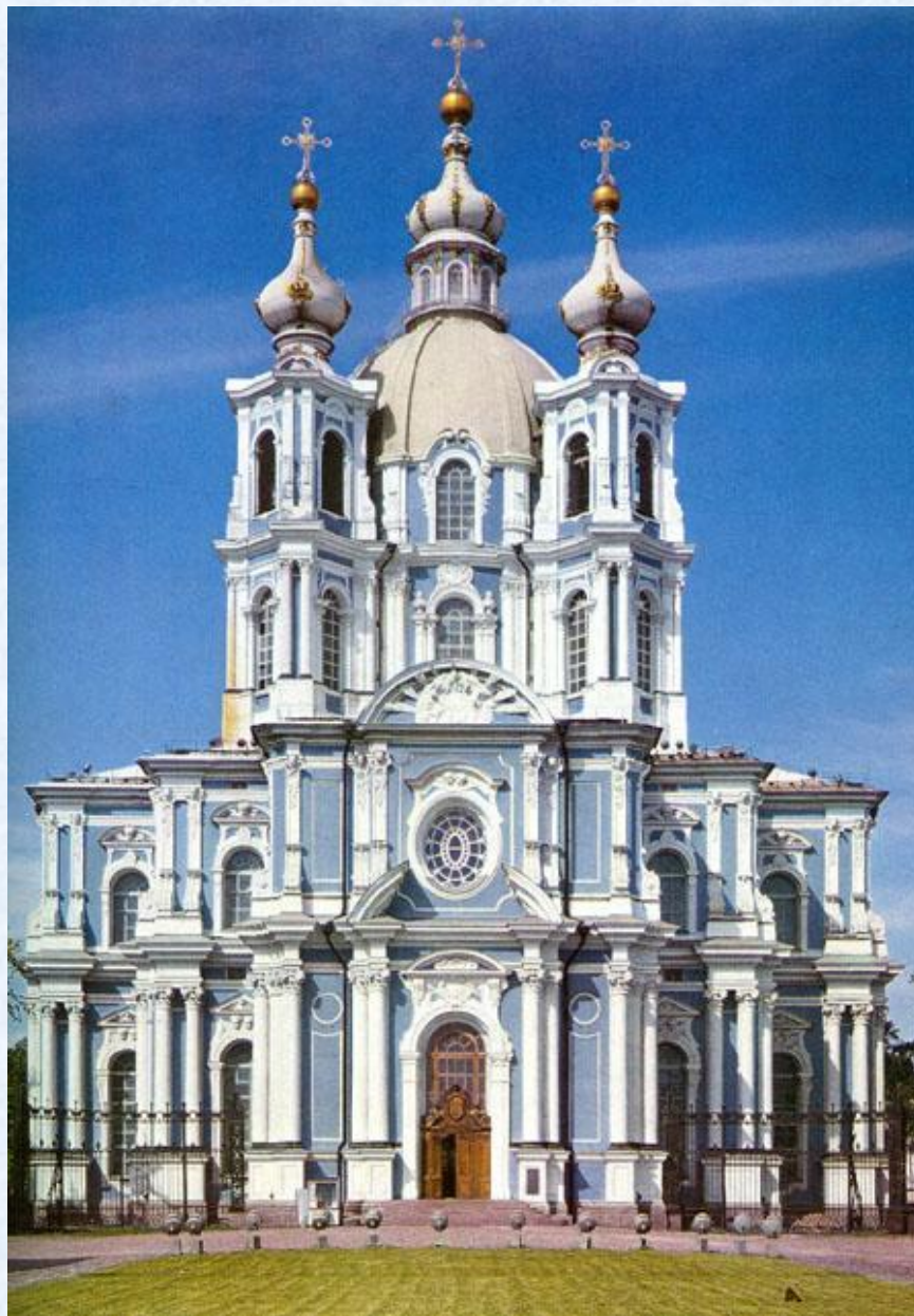
Собор Смольного монастыря. 1748-1764г.г.