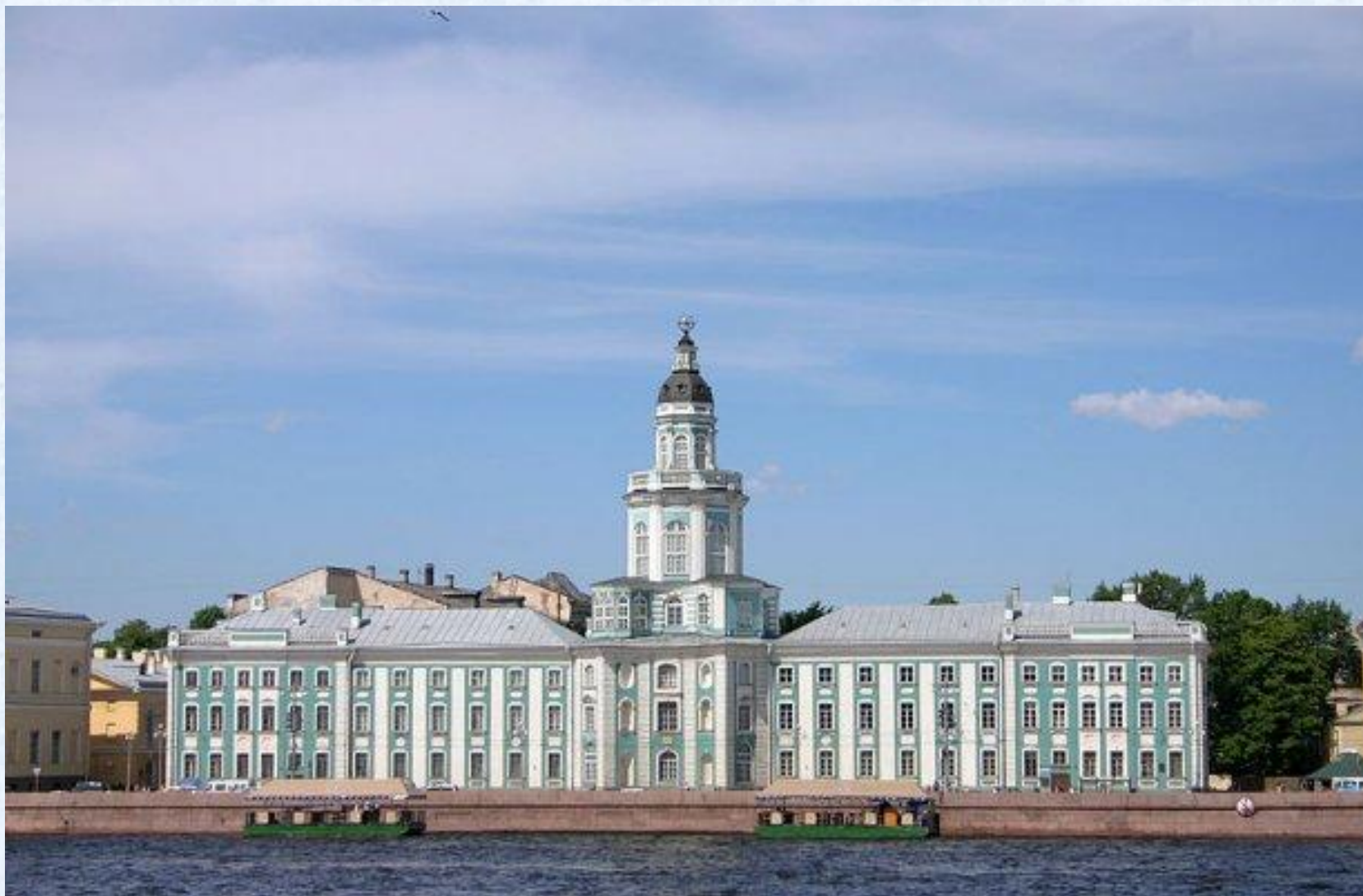
М.Г.Земцов, Г.И.Маттарнови. Кунсткамера. 1718-1734г.г.