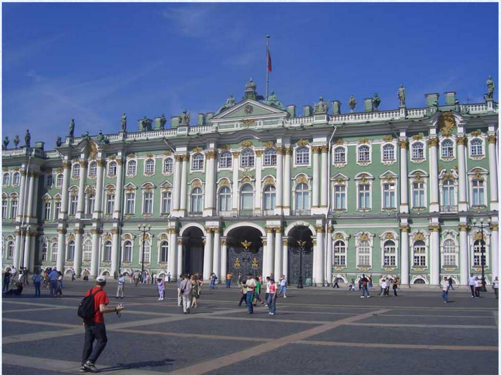
Зимний дворец. 1754-1762г.г.