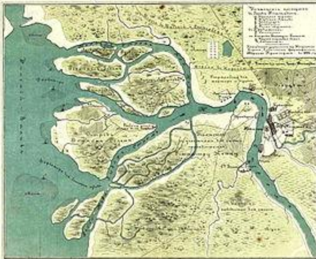
План Санкт-Петербурга (начало XVIII века)

Планъ и точности занимаской нинѣ С-Петербургско, снати въ 1698 году до забвѣніа ея Петраго Великого, съ показаніемъ существующихъ на ней шведскихъ укрѣпленій.