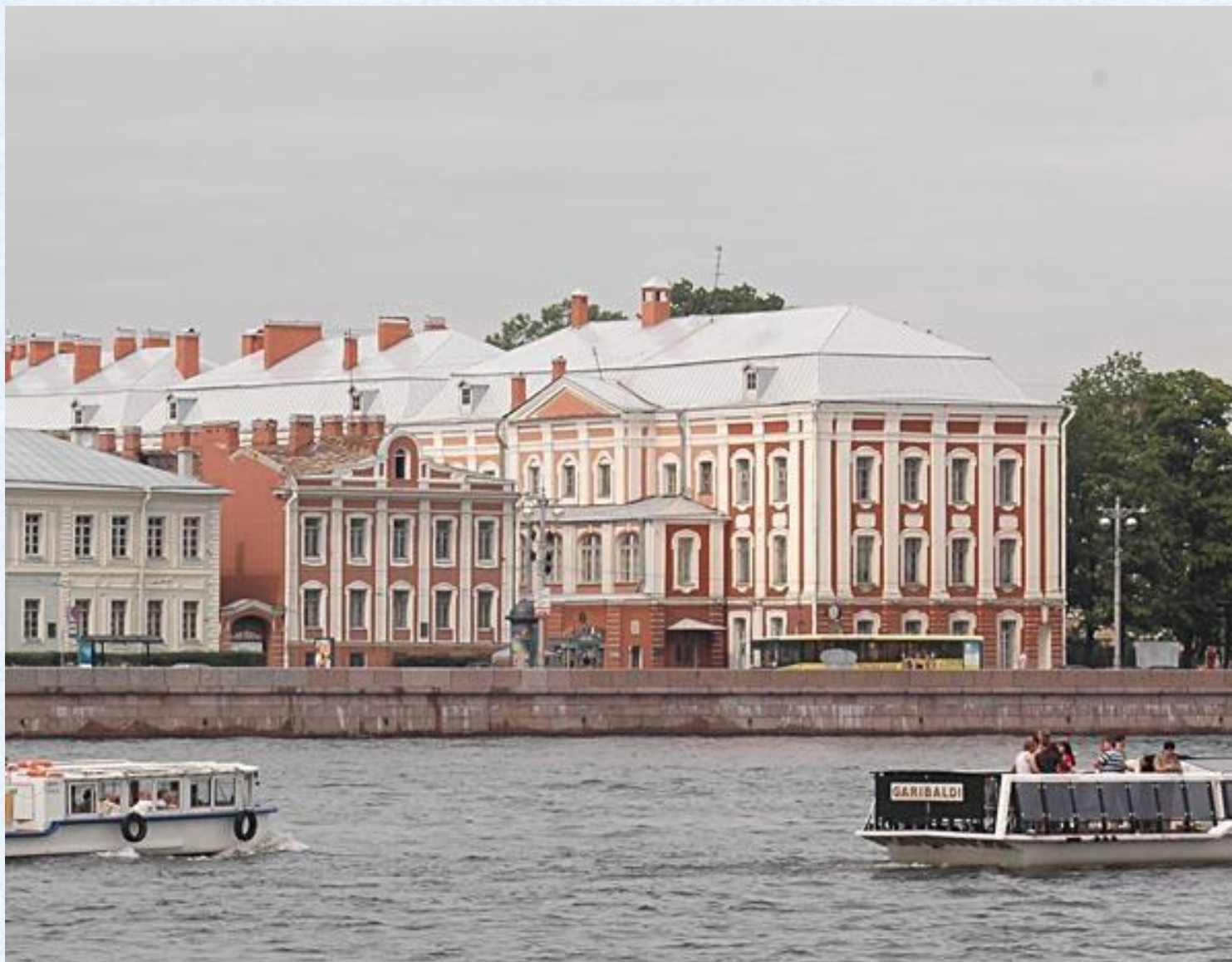
Д.Трезини. Здание Двенадцати коллегий. 1722-1742г.г.