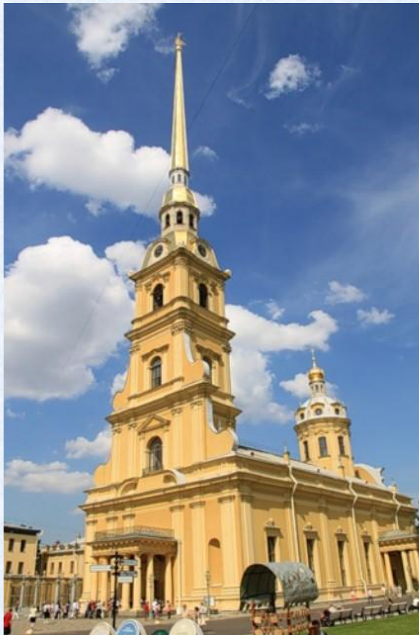
Д.Трезини. Петропавловский собор. 1712-1733г.г.