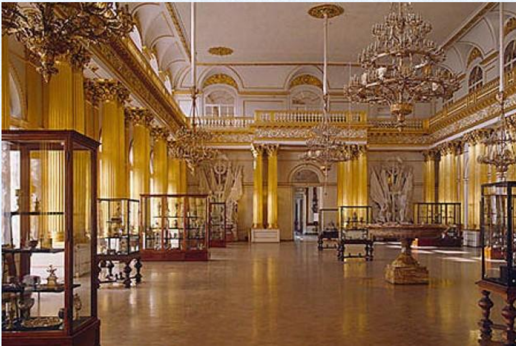
Интерьер Зимнего дворца.