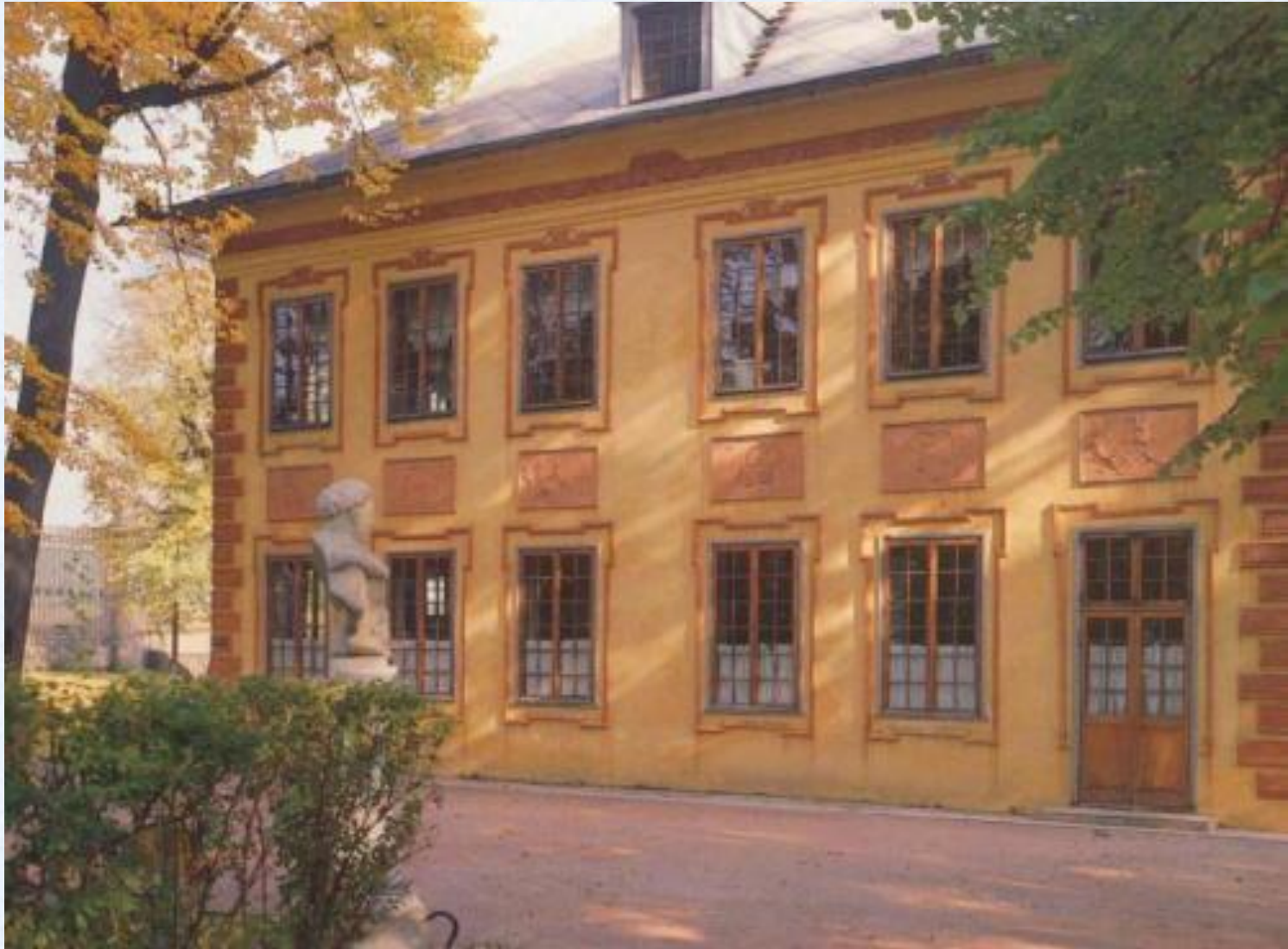
Д.Трезини. Летний дворец Петра I. 1710-1714г. Г.