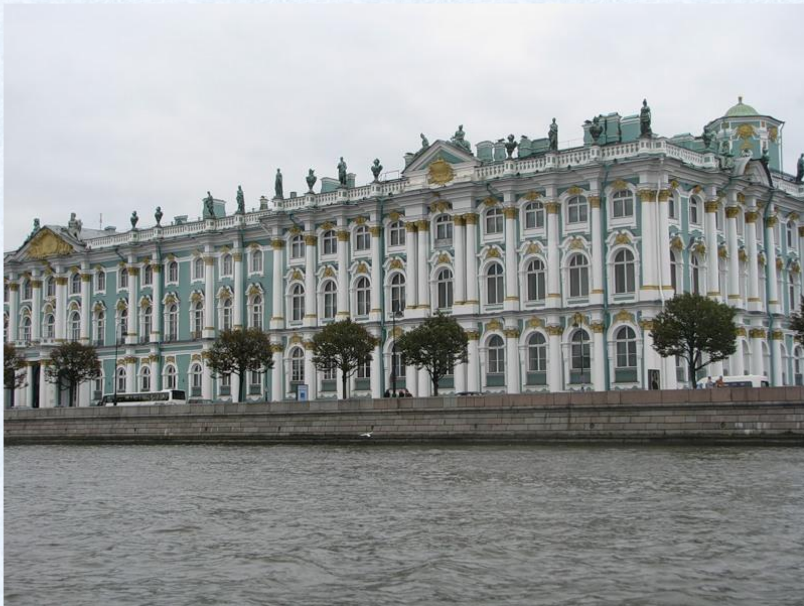
Зимний дворец. 1754-1762г.г.