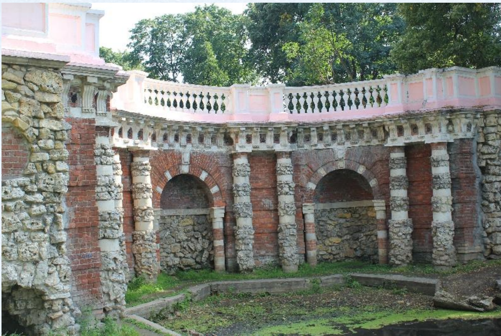
Грот в Лефортовском парке. 1747-1757г.г.