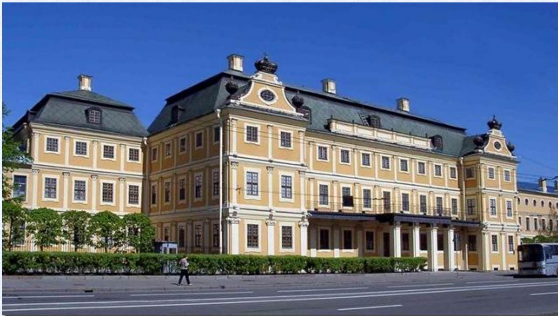
Дж.М.Фонтана, Г.И.Шедель. Меншиковский дворец. 1710-1720г.г.