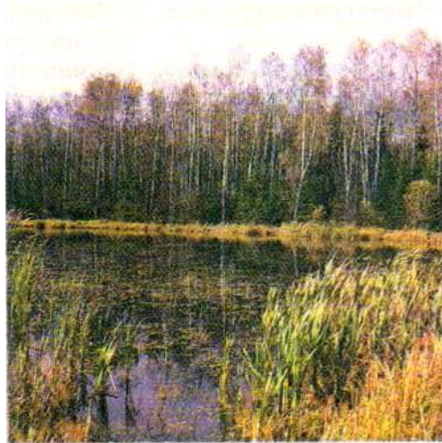
Болото в тайге