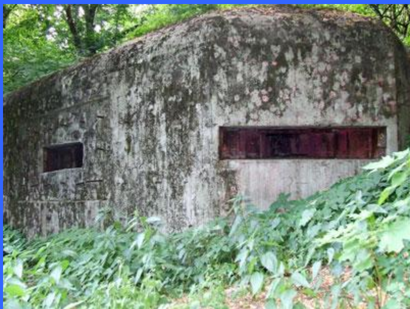
ДОТ № 151– 500 м на юг от с. Кренище, врезанный в Змиевой вал.

Третья полоса войсками не занималась. В резерве коменданта Киевского укрепленного района полковника Ф. С. Сысоева (возглавлял УР с 9 по 19 июля) находились 132-й танковый полк и 20-й погранотряд. На позициях КИУРа в это время насчитывалось около 40 тысяч бойцов, 29 танков, 288 артиллерийских орудий, 148 минометов. 6 июля создается штаб обороны города.