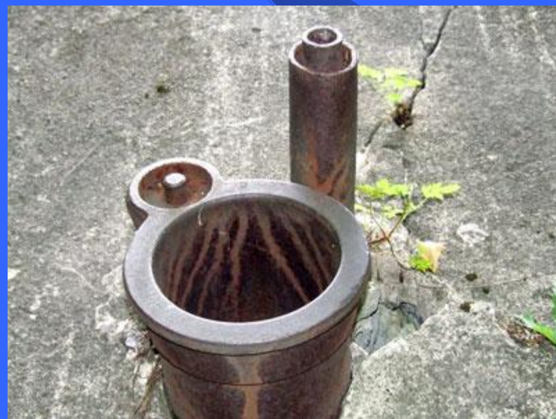
Выход перископа и антенны на крыше ДОТа