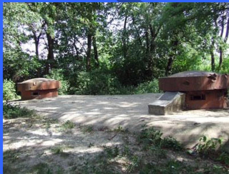
ДОТ № 204 – командно-наблюдательный, с. Юровка