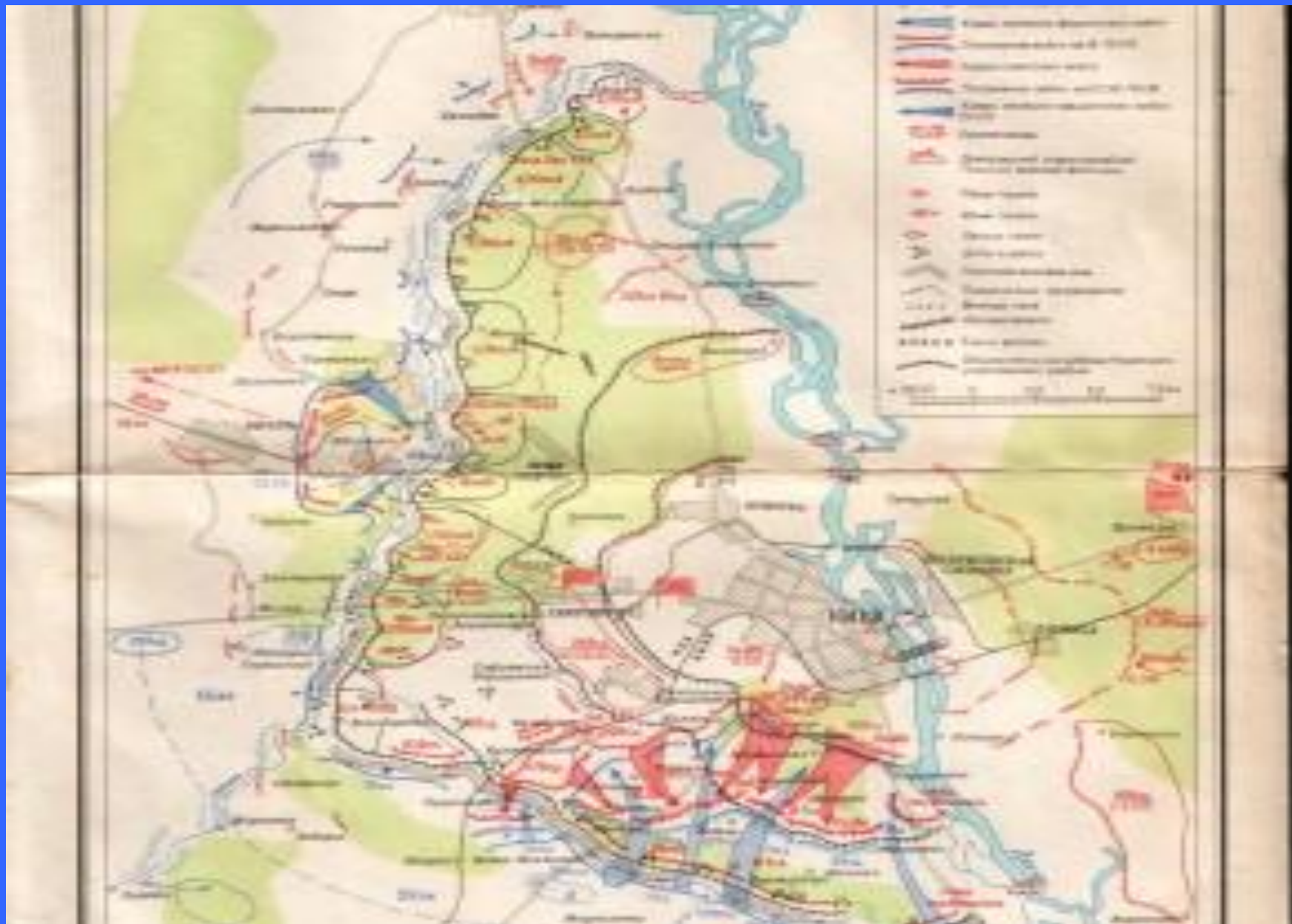
Оборона Киева (11 июля-19 сентября 1941).