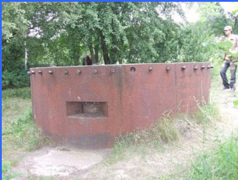
ДОТ № 131 восточная окраина с. Кренище

Оборона второй полосы от Беличей до Никольской Борщаговки возлагалась на 206-ю стрелковую дивизию, а на участке от станции Пост-Волынский до Корчеватого — на 2-ю воздушно-десантную бригаду.