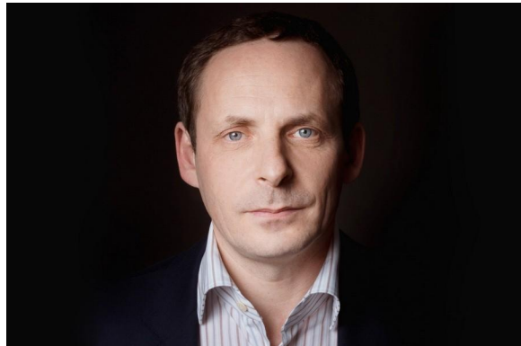
Аркадий Юрьевич Волож и Сегалович Илья Валентинович — российские программисты, сооснователи и руководители группы компаний «Яндекс».