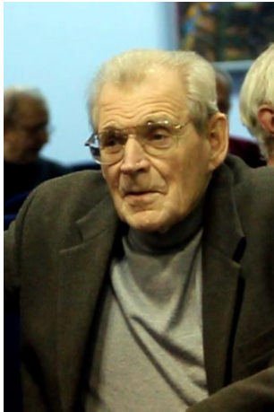
Андрей Викторович Гапонов-Грехов — советский и российский физик, академик РАН. Основатель Института прикладной физики АН СССР в Нижнем Новгороде