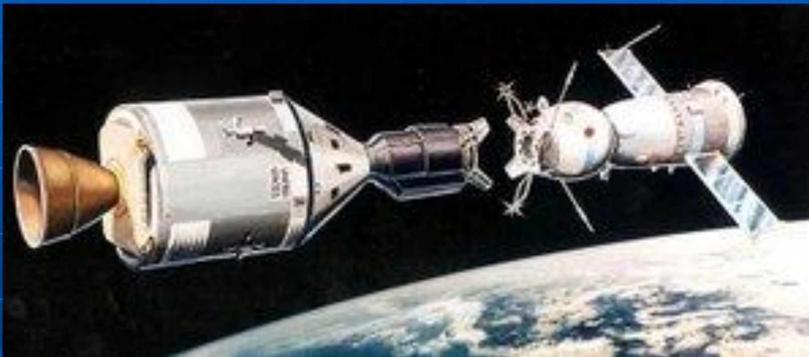
Корабли «Союз» (справа) и «Аполлон» (слева).