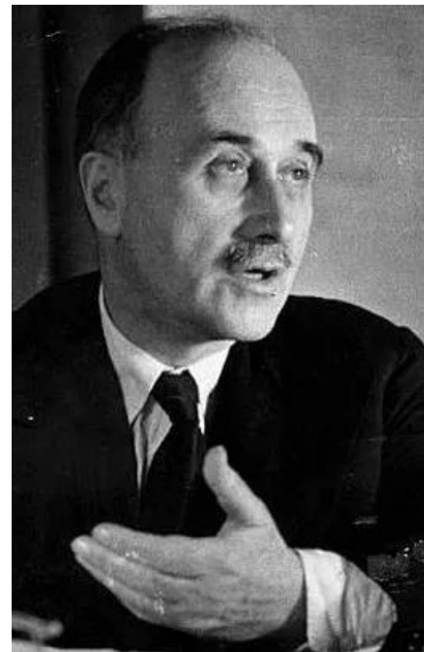
Робер Шуман, Конрад Аденауэр и Жан Монне