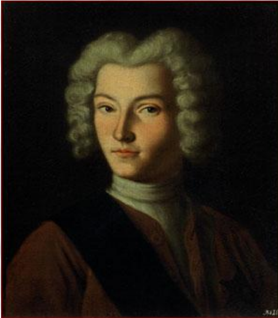
Петр II (1727 -1730гг.)