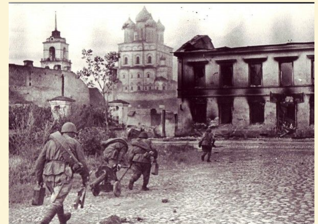
Бой 22 июля 1944 г. в районе Запсковья. г. Псков

В современную историю России золотыми буквами вписан бессмертный подвиг 6-й роты псковских десантников, вступивших в смертельную схватку с силами международного терроризма на Северном Кавказе.