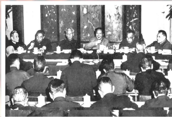
Январский (1961 г.) пленум ЦК КПК

Результаты осуществления «курса на регулирование экономики»