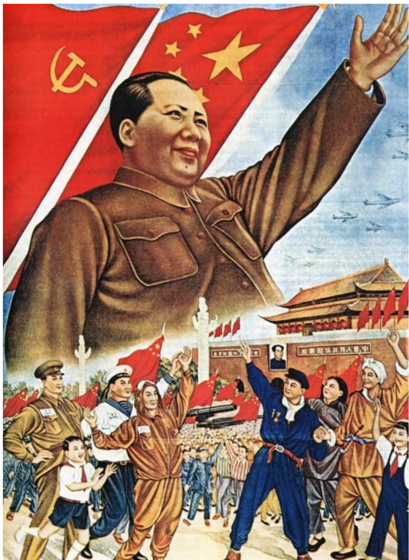
Мао Цзэдун. Плакат

В конце сентября 1949 г. в Пекине состоялось заседание Народного политического консультативного совета, включавшего представителей КПК и других антигоминьдановских политических сил. На заседании было принято решение о создании Центрального народного правительственного совета (ЦНПС) во главе с председателем КПК Мао Цзэдуном. Исполнительная власть передавалась новому китайскому правительству. Главной целью коммунистов стало превращение Китая в «сильную промышленно развитую державу с руководящей ролью рабочего класса и строительство в перспективе социалистического общества».