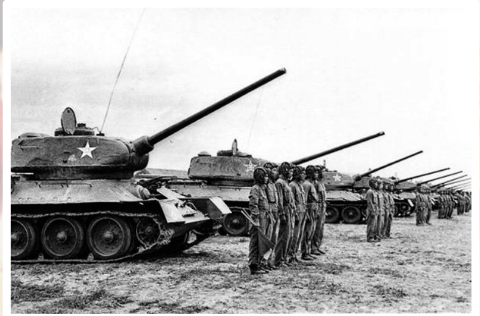
Советские танки в Китае

В это время советское правительство приняло окончательное решение ориентироваться в своей политике по отношению к Китаю только на КПК и его вооружённые силы. Армия КПК получала на вооружение советские самолёты, танки, артиллерию, трофейное японское оружие. В рядах НОАК, достигшей более 2 млн бойцов, находились многочисленные советские военные специалисты. В апреле 1946 г. СССР вывел свои войска из Маньчжурии. Гоминьдановское правительство тотчас отдало приказ о наступлении на северном направлении. В Китае возобновилась гражданская война.