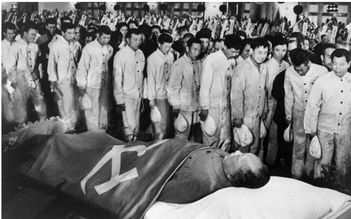
Похороны Мао Цзэдуна

9 сентября 1976 г. 82-летний Мао Цзэдун умер, оставив после себя огромную страну, изолированную от всего мира, неэффективной экономикой.