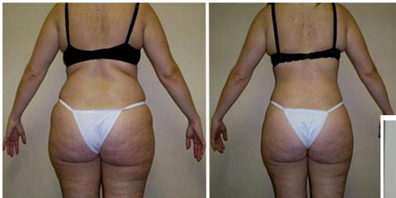
Фото До и После