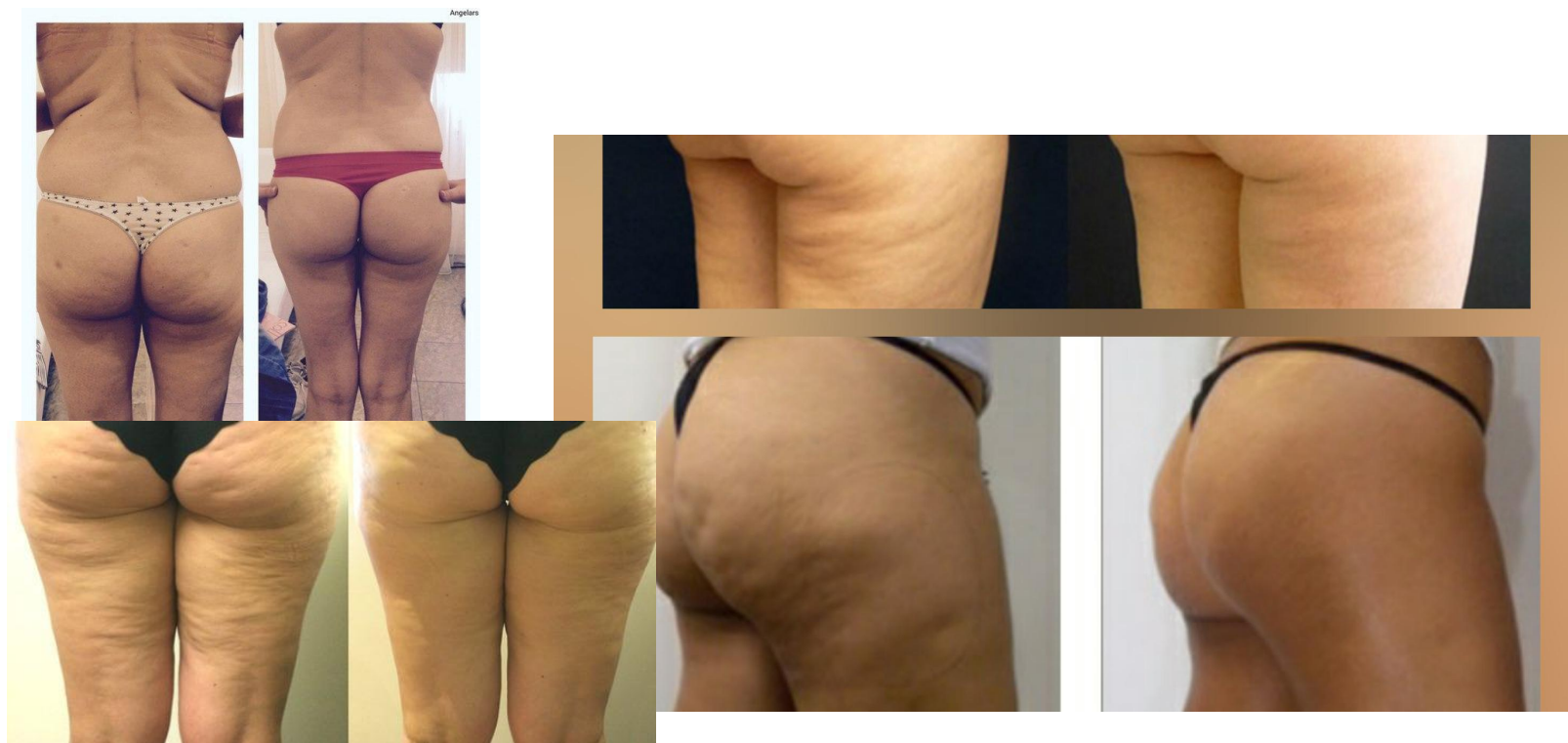
Фото До и После: