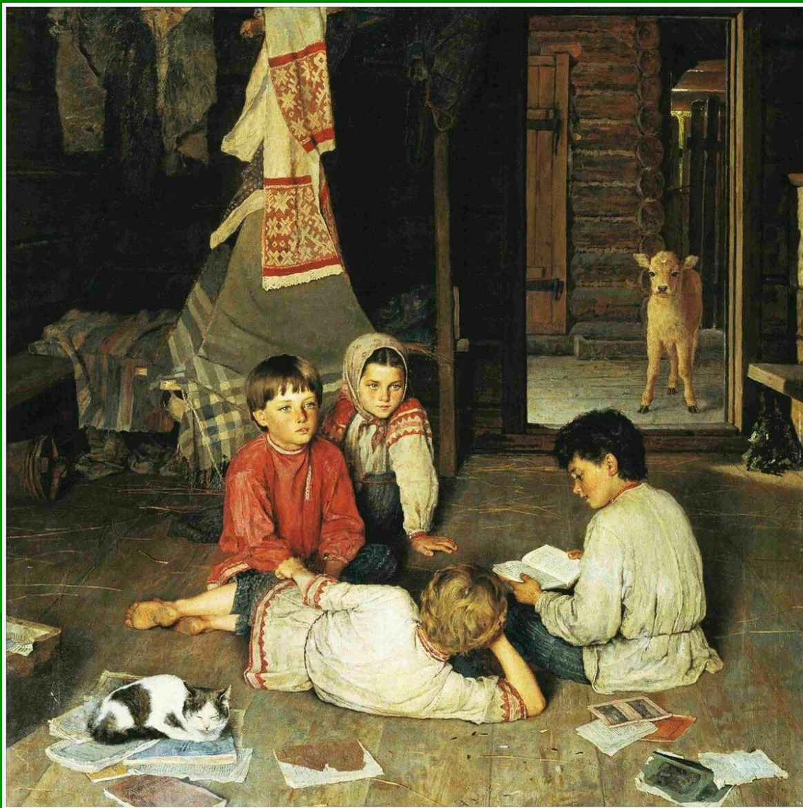
Н. П. Богданов-Бельский. Новая сказка. 1891г.