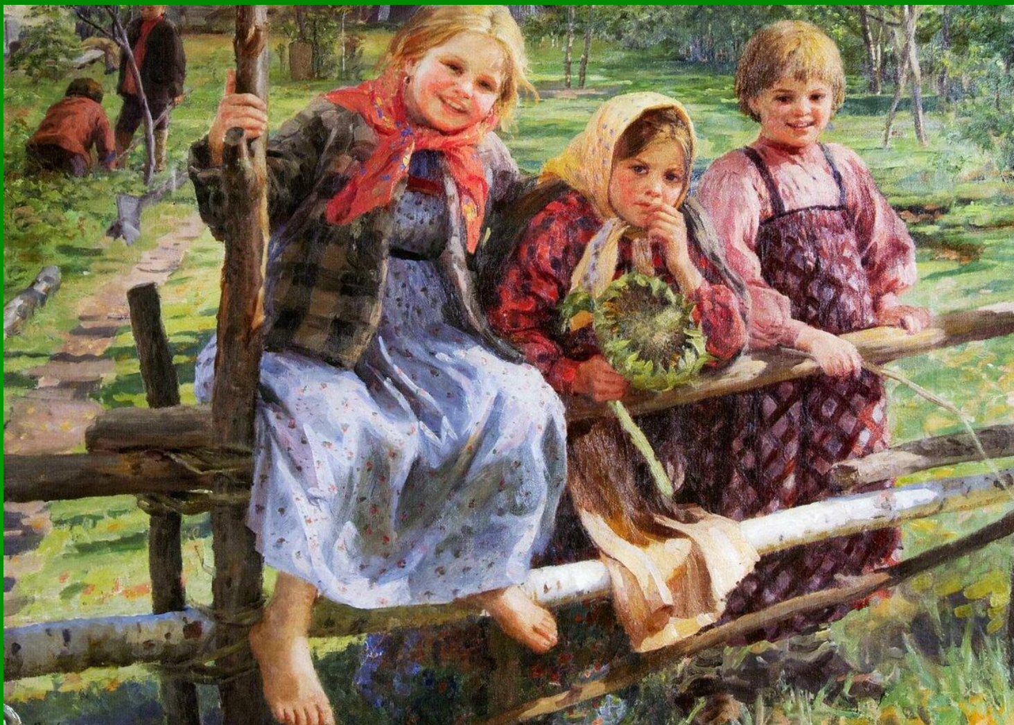
Ф.В. Сычков. Подружки. 1916