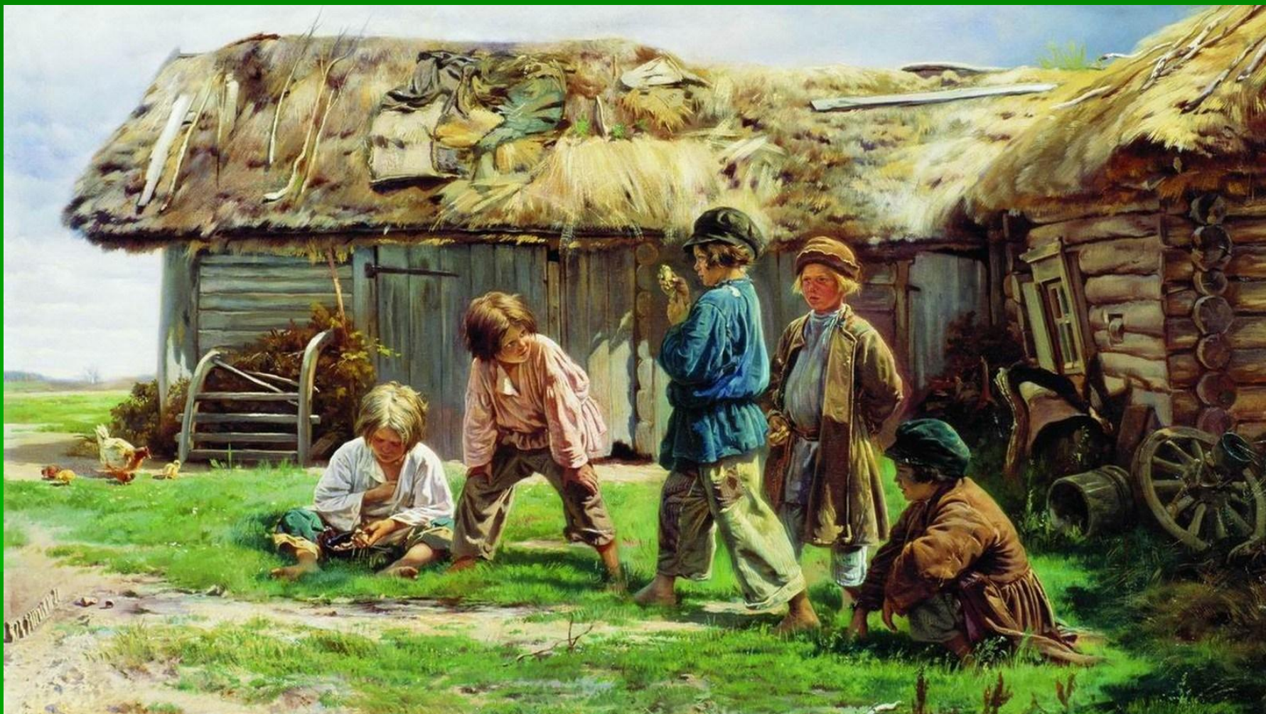
К.Е. Маковский. Игра в бабки. 1870