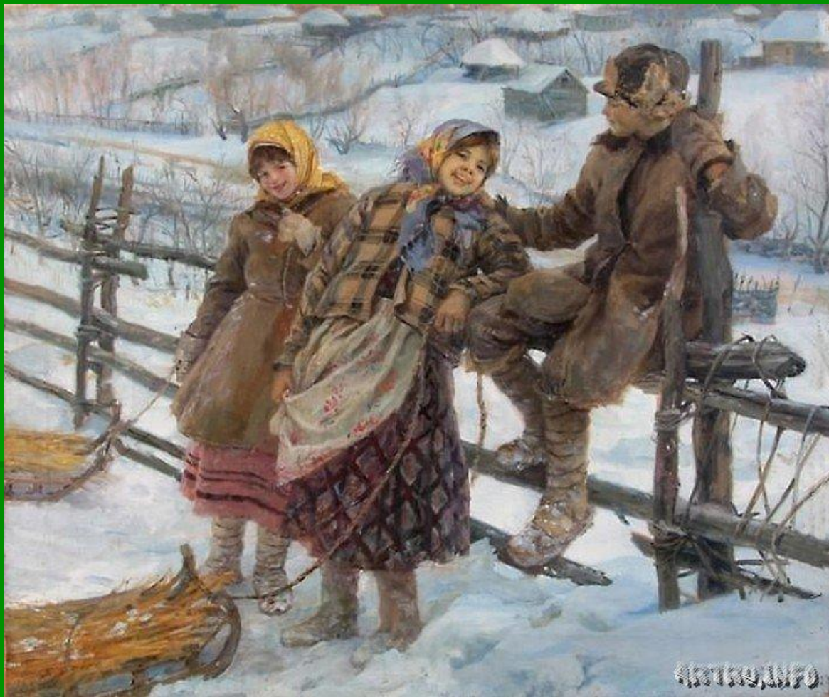
Ф.В. Сычков. После катания. 1923 г.

Отличалась ли одежда крестьянских детей от одежды взрослых?