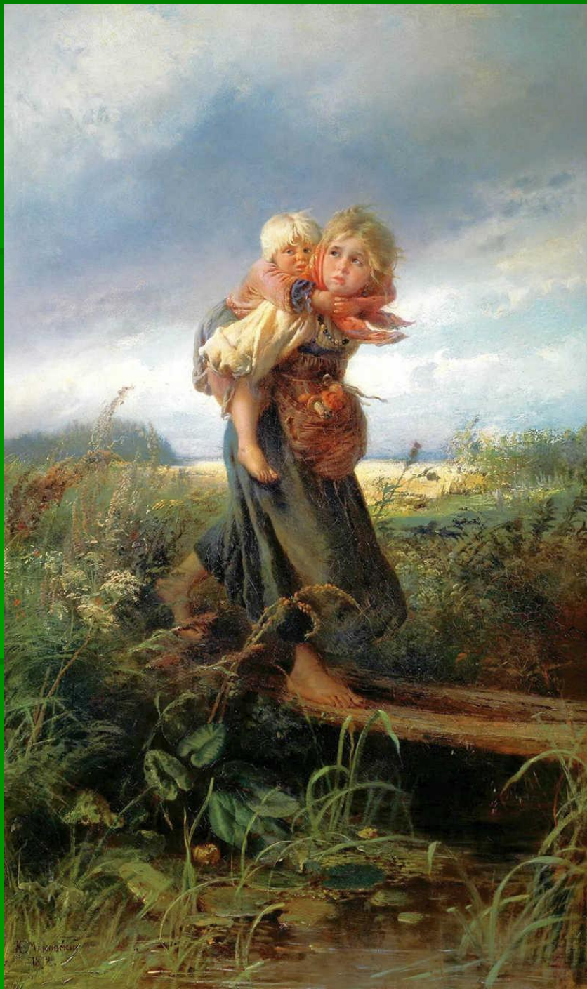
К.Е. Маковский. Дети, бегущие от грозы 1872