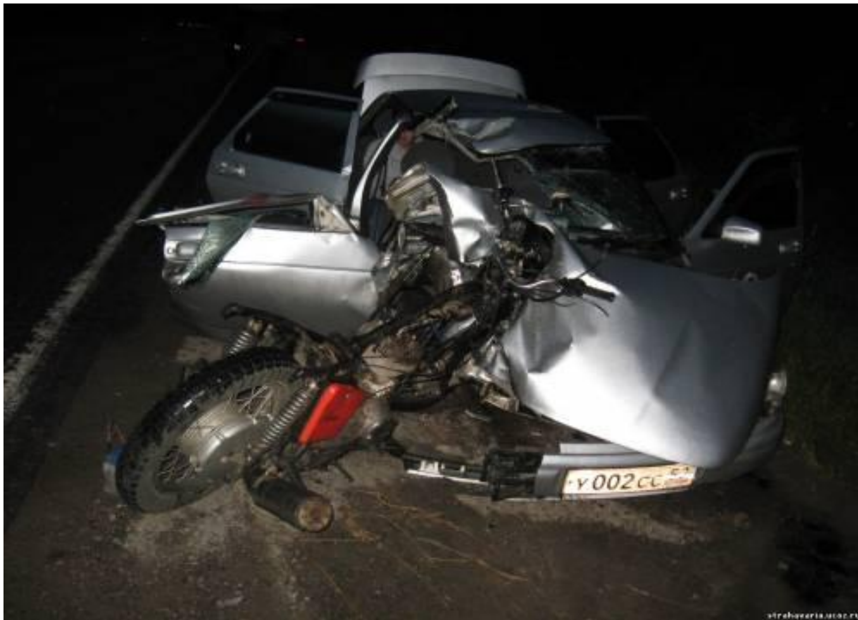
Мотоцикл и автомобиль после катастрофы