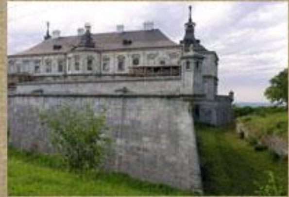
Замок у Підгірцях