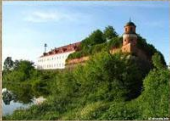
Фортеця у Дубно

Підготуйте повідомлення про місця, що відвідала Наталка з родиною