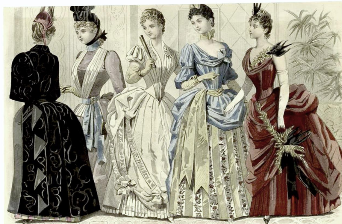
LES MODES PARISIENNES: PETERSON'S MAGAZINE. JANUARY, 1889. AN EVENING RECEPTION.