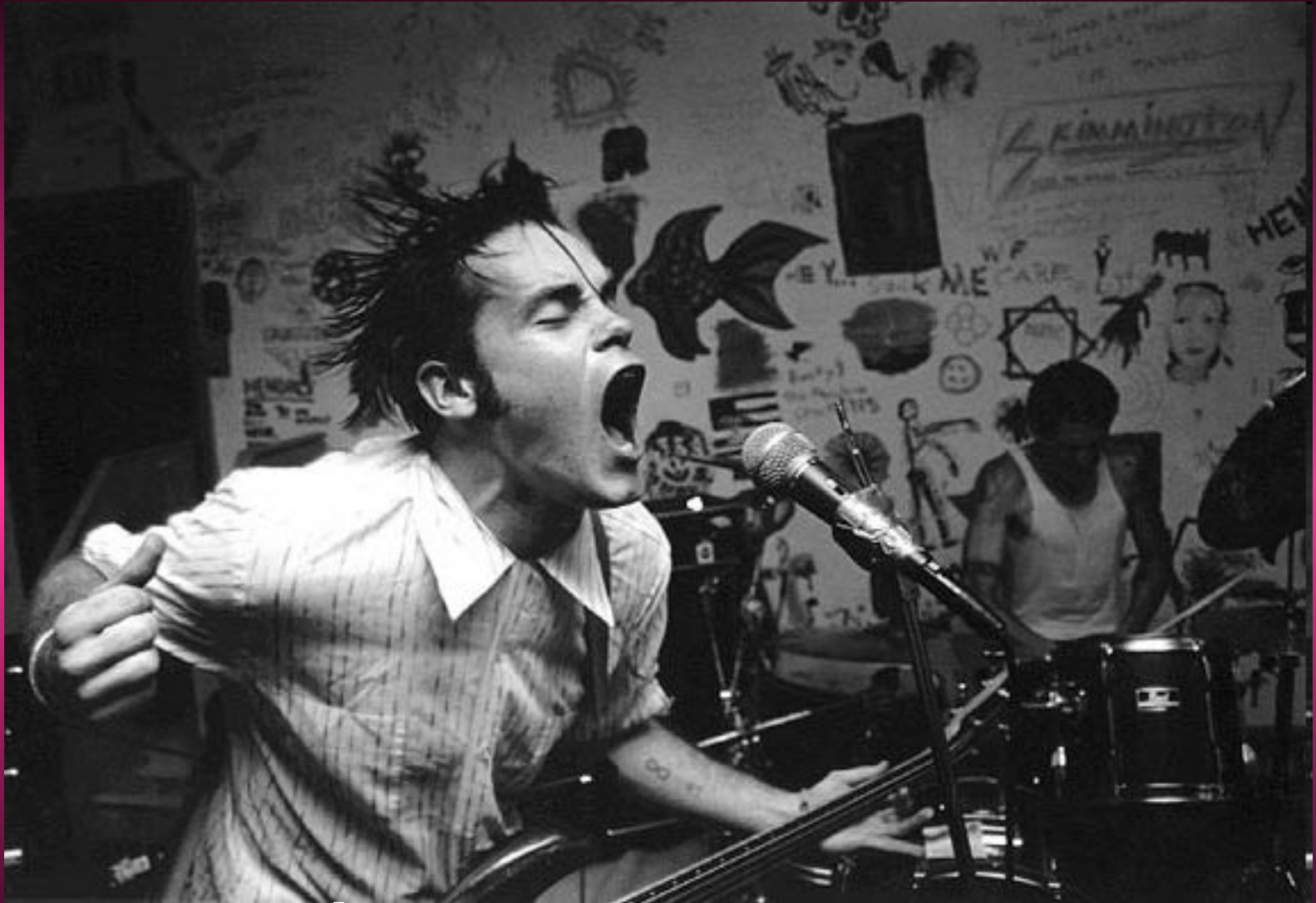
фото группы "Still Life"