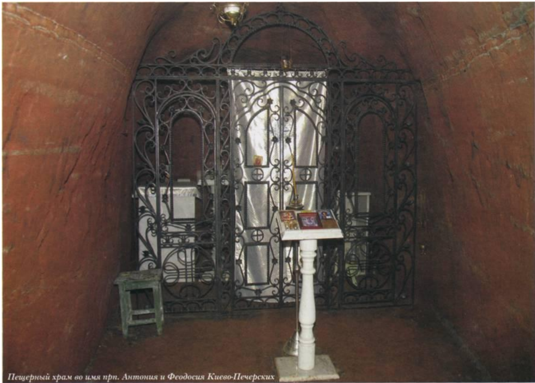
Пещерный храм во имя прп. Антония и Феодосия Киево-Печерских