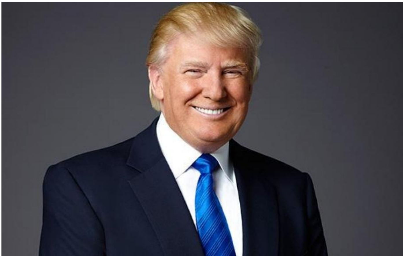
Дональд Трамп (представляет Республиканскую партию)