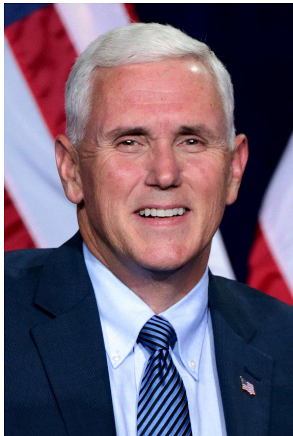
Майк Пенс (представляет Республиканскую партию)