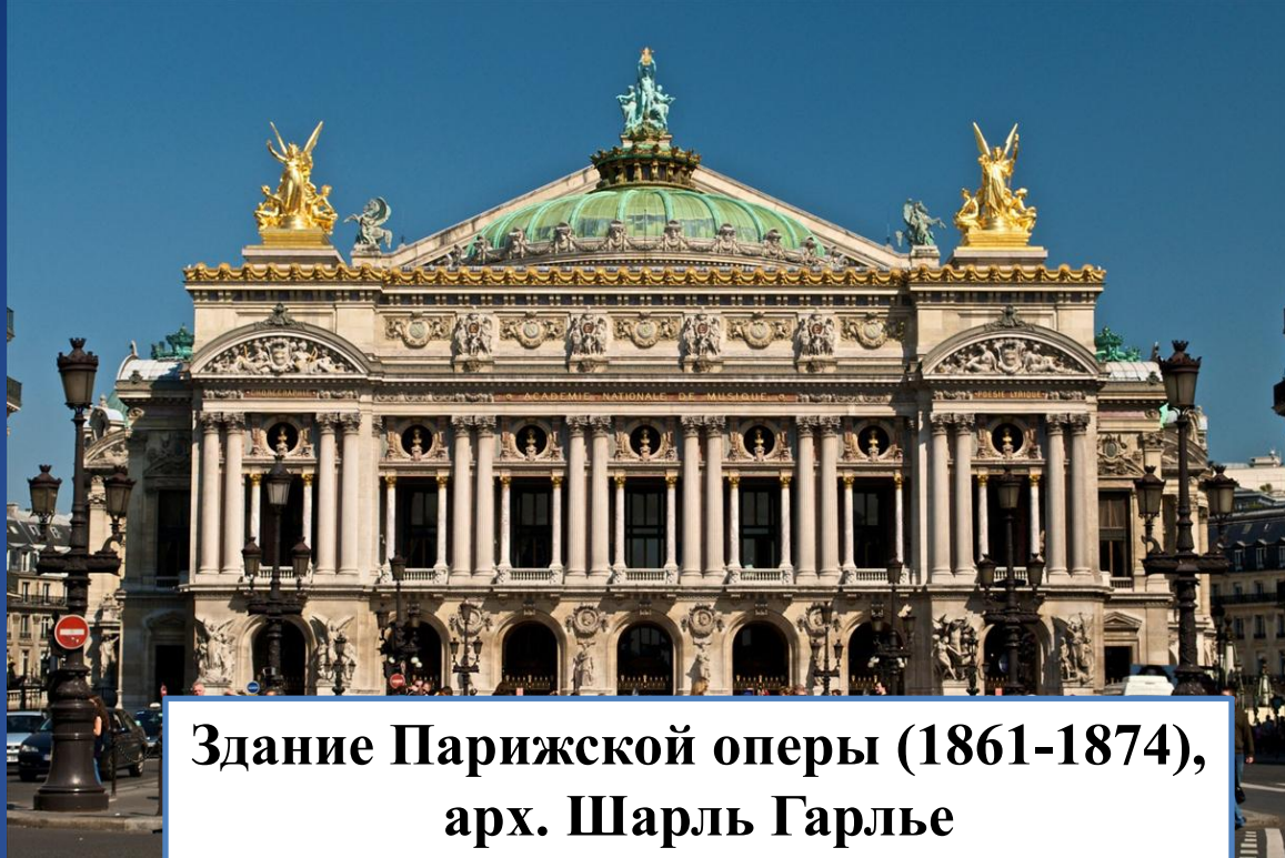
Здание Парижской оперы (1861-1874), арх. Шарль Гарлье