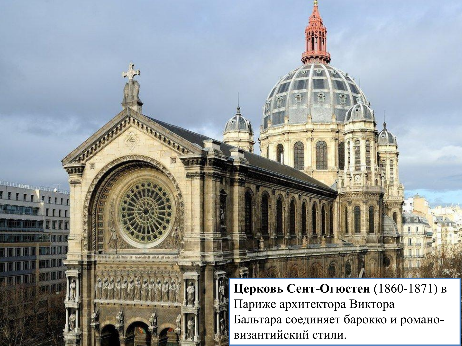
Церковь Сент-Огюстен (1860-1871) в Париже архитектора Виктора Бальтара соединяет барокко и романо-византийский стили.