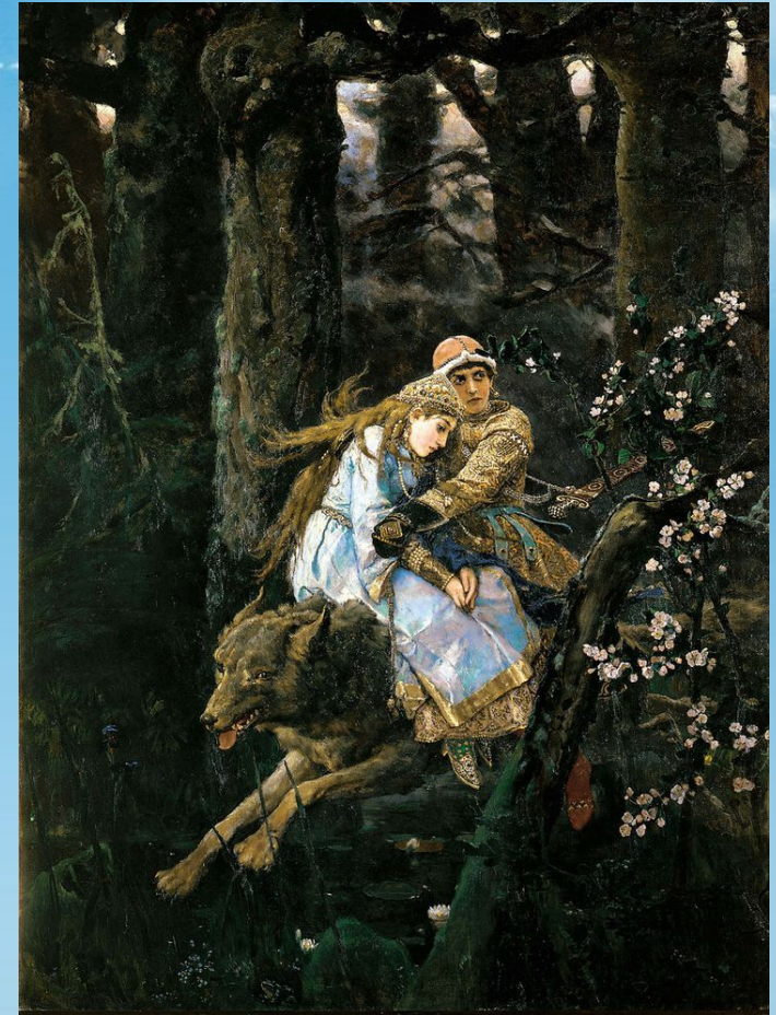
В. М. Васнецов «Иван-царевич на сером волке»