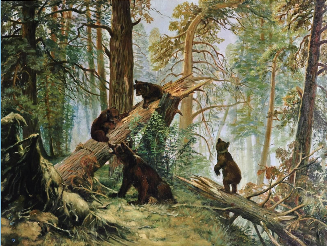
И. И. Шишкин «Утро в сосновом лесу»