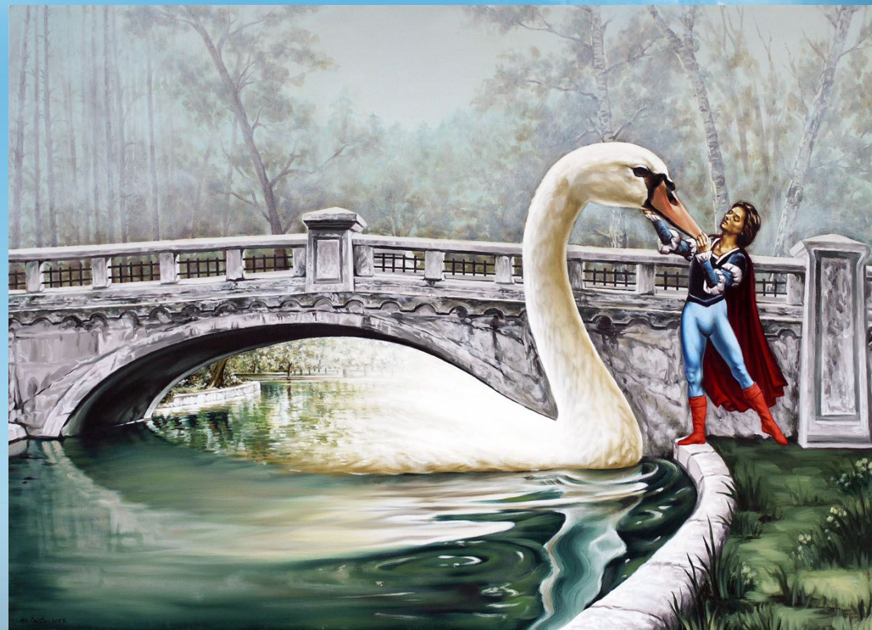
Художник Михай Кристе