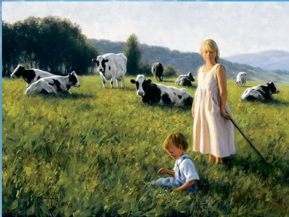
Художник Роберт Дункан