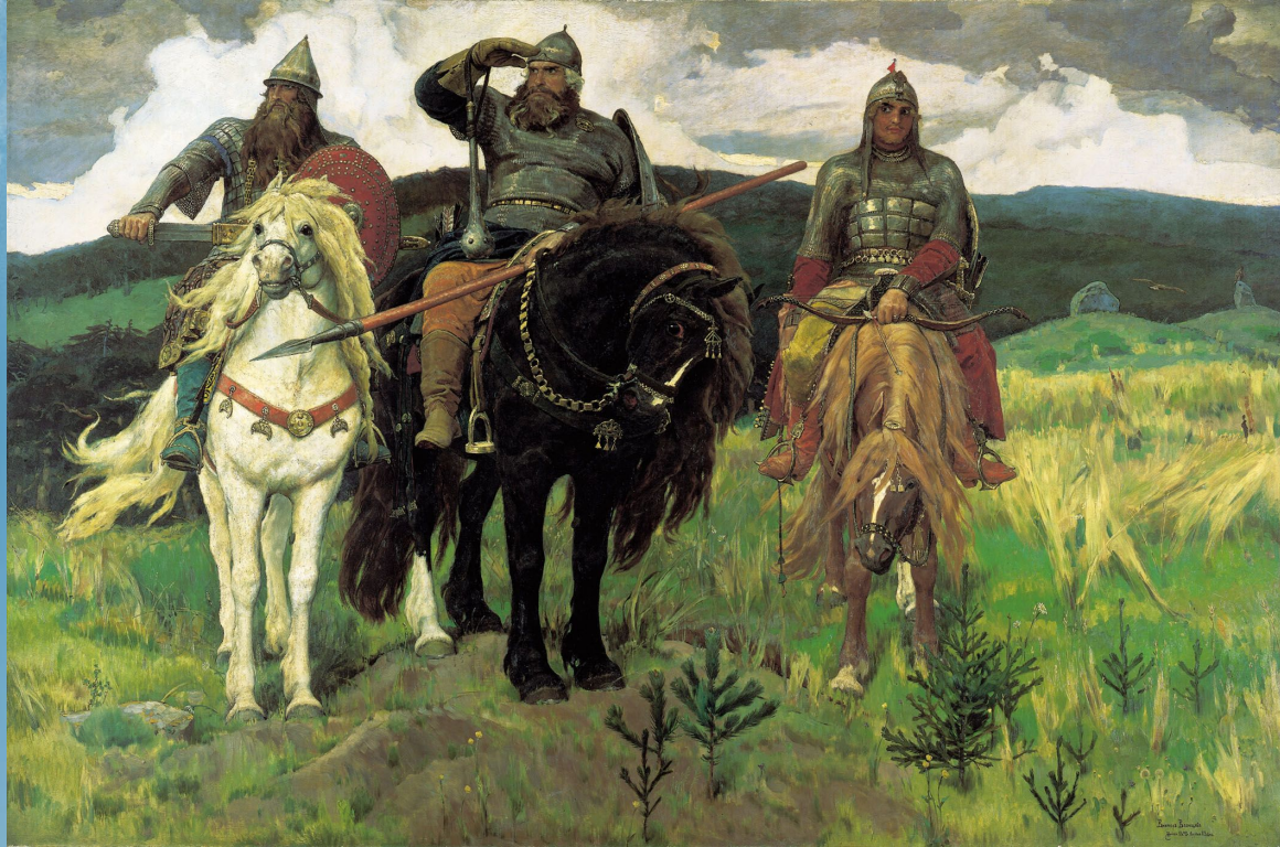
В. М. Васнецов «Богатыри»